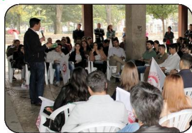
avulso e só querem um cheque em branco para manter o poder".

O candidato do PS à presidência da Câmara falou sobre as 10 áreas estratégicas e a 100 medidas concretas do programa eleitoral "Famalicão mais Forte", que são "um sério compromisso com os Famalicenses", tanto mais que "outros nem programa apresentam, copiam as nossas ideias de modo