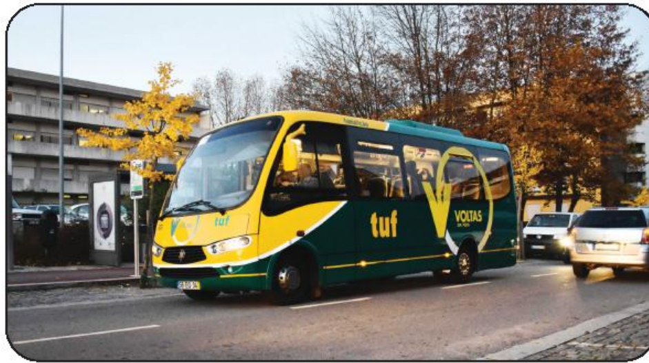
Circuito urbano foi inaugurado a 22 de setembro de 2016

Voltas veio dar a ajuda que faltava para que os famali-