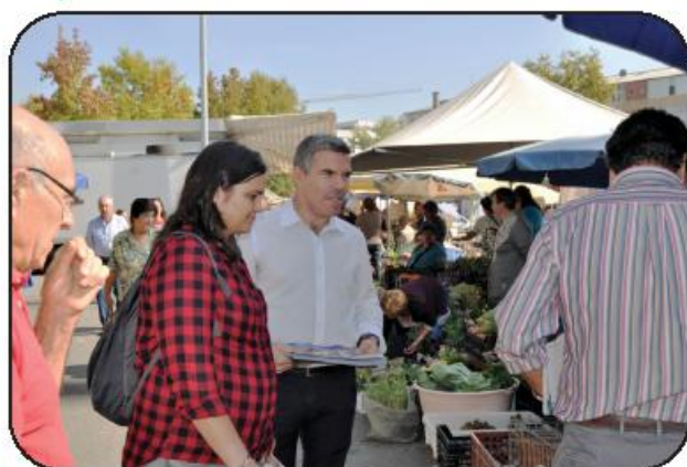
Partido diz ser a candidatura de "verdadeira esquerda socialista"

O BE afirma-se "cada vez mais como a candidatura de verdadeira esquerda socialista e não pactua com a falta de ética na política". Para o partido "o importante é esclarecer as populações e não andar a ver quem apoia quem". No entender dos blo-