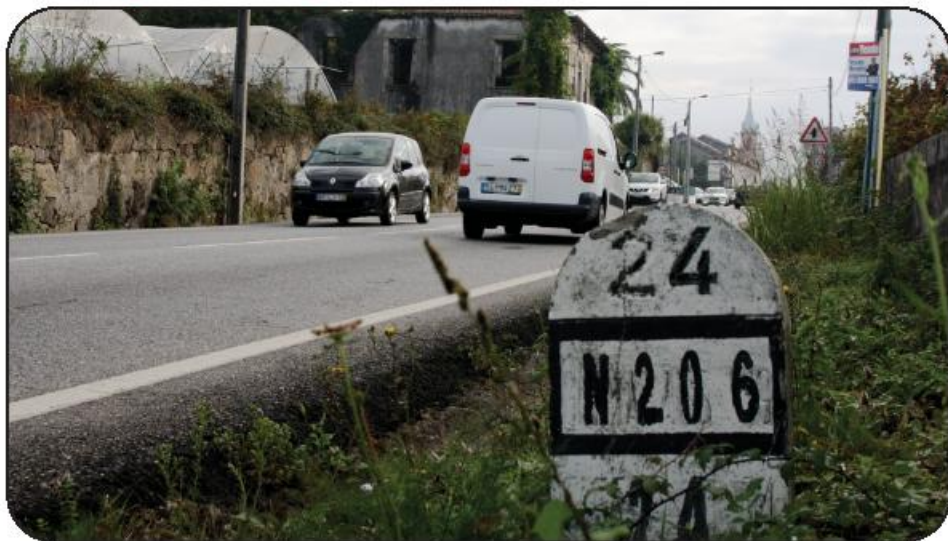
Projecto de intervenção na EN 206 está num impasse há pelo menos uma década