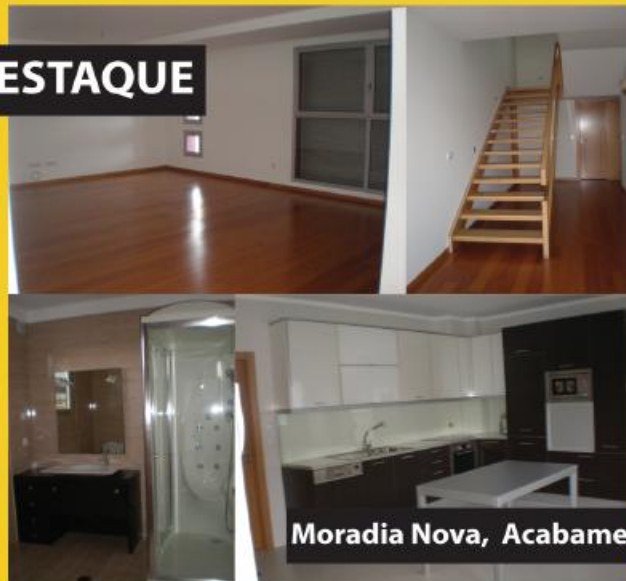
Moradia Nova, Acabamentos luxo