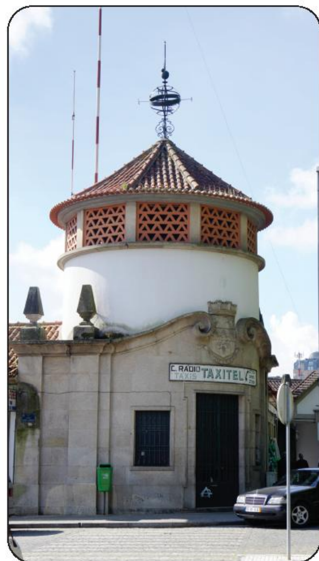
Projeto prevê a preservação da traça original do edifício que hoje se conhece