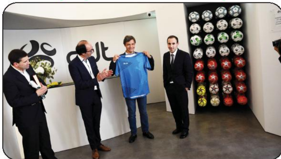
Novas instalações resultam de um investimento da ordem dos 300 mil euros

Para além do Moreirense e Tondela, a marca famalicense veste muitas outras