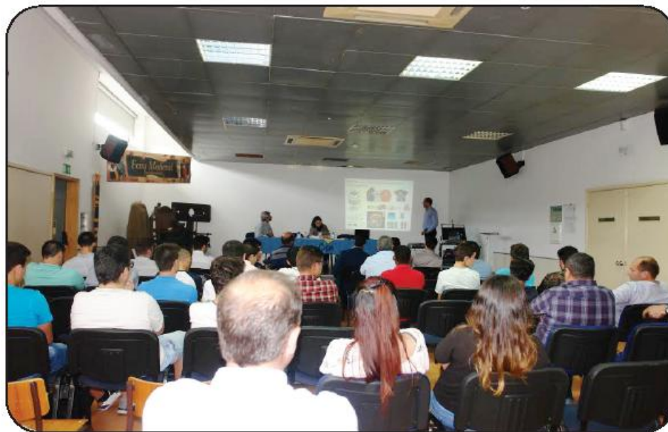
O debate contou com a presença de técnicos e empresários dos etor

os e oportunidades diretamente relacionados com a produção metalomecânica foram alvo de reflexão e debate, que envolveu empresários, técnicos, formadores e alunos. A mecatrónica também foi uma área profissional objeto de abordagem.