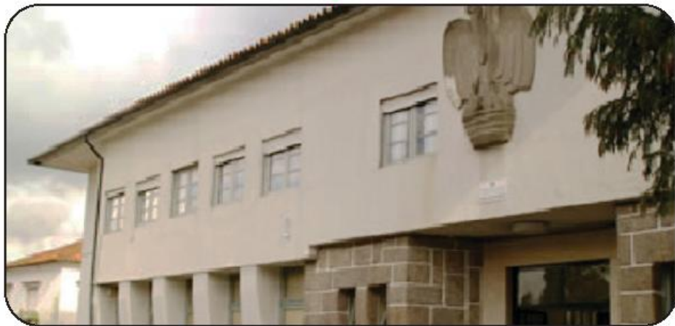
Reabilitação poderá ter o custo acrescido de dez anos de abandono pela tutela

Dez anos depois da inauguração do novo Centro de Saúde de Delães, que desde o início pressupunha a entrega do edifício antigo ao município por contrapartida da cedência de terreno para a obra, a transferência da tutela para a Câmara Municipal deu, finalmente, o primeiro passo. A proposta para a formalização da permuta, através de escritura pública, foi aprovada em reunião do executivo municipal, na passada quinta-feira, agora que o Estado desbloqueou a situação.