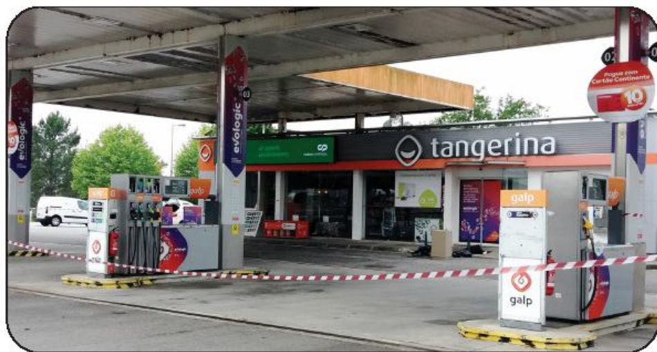
S.R.G. Cofre foi arrombado e abandonado no exterior da loja

Na sequência do assalto, a bomba de gasolina esteve encerrada durante todo o dia de sábado, enquanto decorreram perícias que possam conduzir à identidade dos assaltantes. A investigação segue a cargo da PJ.