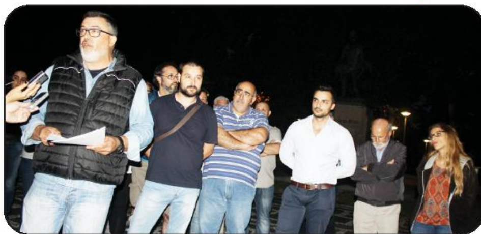
Conferência de imprensa teve lugar junto ao monumento em honra do Bombeiro Voluntário

Numa conferência de imprensa agendada para a noite da passada quinta-feira, reiteraram que não vão "desistir" de fazer valer a sua voz até que a direção se demita. "Saíram enquanto é tempo!", sugerem, e aproveitam para denunciar a subversão dos investimentos patrocinados pe-