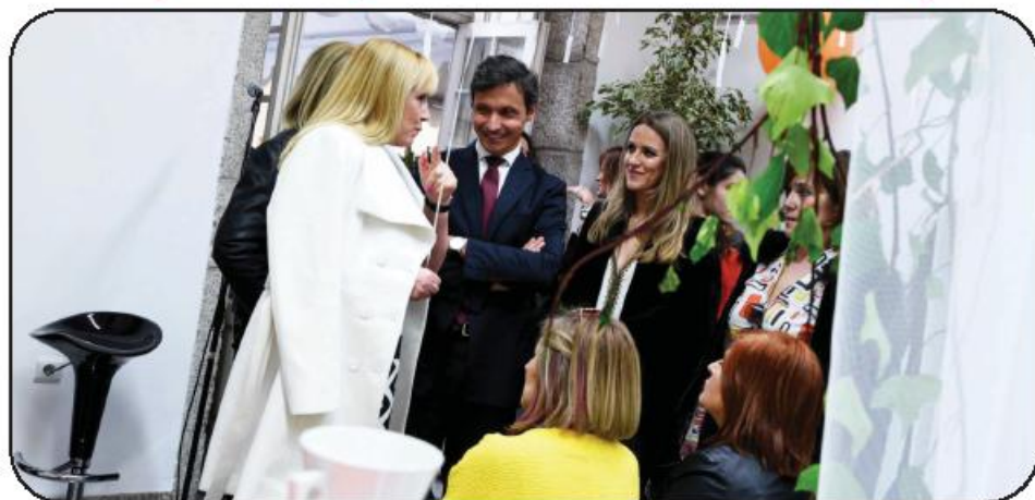
Iniciativa teve lugar no Palacete Barão da Trovisqueira, onde se encontra instalado o Museu Bernardino Machado

O edil considera, assim, que é de afirmação da diferença o trabalho que a autarquia famalicense continuará a desenvolver neste domínio. "Enquanto for presidente de Câmara", assumiu, "tudo o que fizer em termos de igualdade de género será sempre