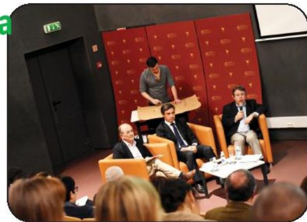
Próximo fórum é na CSIF do Vale do Este

O presidente da Câmara Municipal de Vila Nova de Famalicão, que marcou presença neste primeiro Fórum, deixou claro que "é fundamental respeitar as diferenças das pessoas e do território e importante aproveitar as sinergias de proximidade cria-