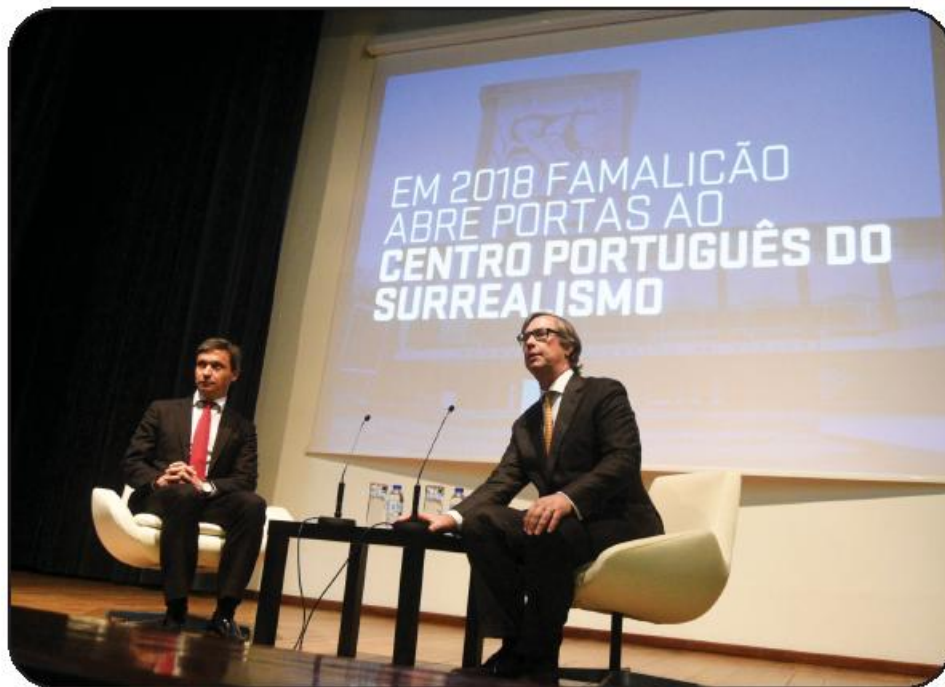
O espaço museológico propriamente dito passará a beneficiar de uma área com cerca de 700 metros, para exposições temporárias