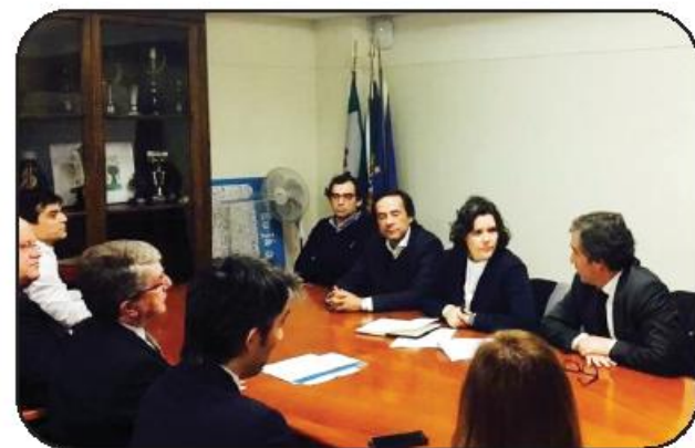
Líder do CDS-PP reuniu com administração do CHMA

Em discussão esteve também o apoio que os Municípios facultam aos Centros Hospitalares, que no caso particular do Centro Hospitalar do Médio Ave, tem sido importante. Falou-se em específico de um projeto que tem merecido o apoio da Câmara de Famalicão que passa pela ampliação e criação de melhores condições no serviço de obstetria e pediatria, uma vez que Vila Nova de Famalicão "é um concelho jovem e com uma taxa de