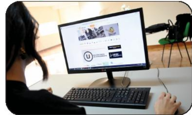
"Planos e Relatórios", "Taxas e Regulamentos", "Relação com a Sociedade", "Contra- tação Pública", "Informação Económica - Financeira" e "Urbanismo".

Refira-se ainda que o Índice de Transparência Municipal baseia-se no levantamento da informação de interesse público disponível nos sites dos 308 municípios portugueses, segundo 76 indicadores divididos em 7 áreas - "Organização, composição e funcionamento",