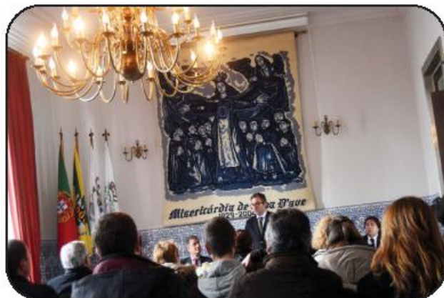
Programa foi apresentado no auditório da Santa Casa

Orientado para o apoio diversificado aos doentes com demências, às famílias e à comunidade, mas também para o estudo e investigação do fenómeno, o CIDIFAD pretende ser um "centro interativo" que envolva todos os que são tocados pelo flagelo da demência, numa lógica de entajada que favoreça o tratamento e acompanhamento de cada doente. A infraestrutura contará com 80