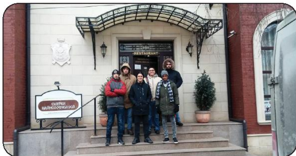
Grupo de alunos que seguiu para a Roménia

Um grupo de 18 alunos do 12.º ano da Escola Profissional Cior iniciou, na semana passada, estágios profissionais, em diferentes países da Europa, no âmbito do Programa Erasmus+, através do projeto "GPS4 – Get Professional Skills".