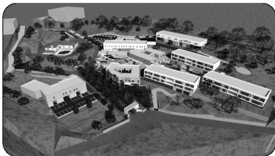
CIDIFAD vai nascer numa quinta com cerca de quatro hectares, ao lado da Santa Casa, e deverá entrar em funcionamento em meados de 2018

tação do livro da instituição, um jantar de homenagem e atribuição de galardões pelos 25 e 30 anos de Irmãos. A 22 de Setembro, na Didáxis, terá lugar o Dia do Património das Misericórdias, e um colóquio subordinado ao tema desse património. Para Outubro está prevista a realização de uma homenagem aos casais de Riba de Ave, entre os 35 e os 50 anos de matrimónio, com a entrega da Bênção Apostólica do Vaticano. O programa termina em Novembro, desta feita no Externato Delfim Ferreira, com a celebração do Dia das Misericórdias, com entrega de prémios das Jornadas, e cerimónia de