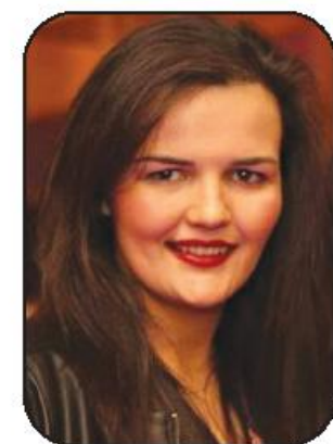
Praça Dona Maria II.

Na nossa cidade tem sido também realizado um trabalho louvável nesta área, que teve também destaque na revista visão na época Natalícia passada, através da "Aldeia Natal" realizada na