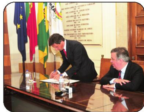
Protocolo com o Estado e AMA foi assinado em meados de 2015

O autarca deixa claro que o importante é que a Loja do Cidadão se faça, e lembra ao PS local que, a quererem responsabilizar-se Governos pelo facto de ela ainda não existir em Vila Nova de Famalicão, “teremos que recuar a Governos do PS, dois, liderados pelo engenheiro José Sócrates, que executaram dezenas de Lojas do Cidadão no país”. Portanto, alega, “não vale a pena querermos responsabilizar o anterior