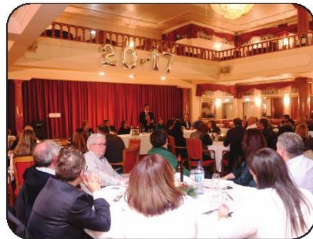
dente da Câmara, a vereação e os presidentes de junta de freguesia”.