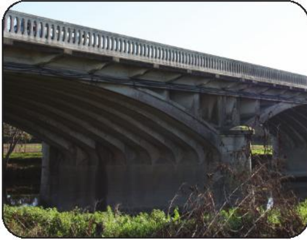
“IP” garante que intervenção não trará quaisquer transtornos ao trânsito

Segundo o comunicado, os trabalhos a realizar “englobam a limpeza, tratamento e preenchimento com betão das zonas submersas identificadas, bem como a remoção dos detritos existente no leito do rio”. O concurso público para a execução da empreitada já foi publicado em Diário da República, apontando para um valor base da