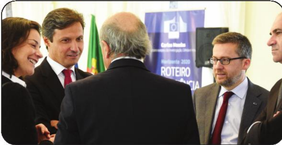
Carlos Moedas ao lado do presidente da Câmara, durante a visita do comissário

O comissário europeu aplaudiu a iniciativa e a filosofia colaborativa do projeto, deixando claro o setor do agroalimentar é uma das três áreas onde o desafio da ciência e da inovação mais se coloca no futuro. Por isso mesmo, salientou a oportunidade da ideia, consciente de que Vila Nova de Famalicão, pela expressão industrial que tem no setor, é aquele que se encontra me-