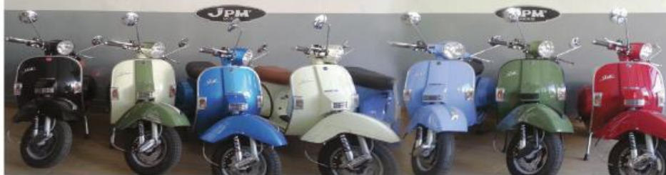
LML - 125 NOVAS, ENTREGA IMEDIATA DESDE 2.049 €

Campanha SCOMADI, LML, DAELIM em todos os modelos s/ entrada e s/ juros, 20 / 24 / 36 meses