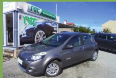
RENAULT CLIO 1.2 16V DYNAMIQUE S 2010 VARIAS UNIDADES EM STOCK