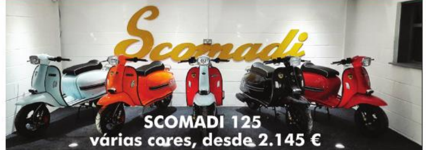
SCOMADI 125 várias cores, desde 2.145 €