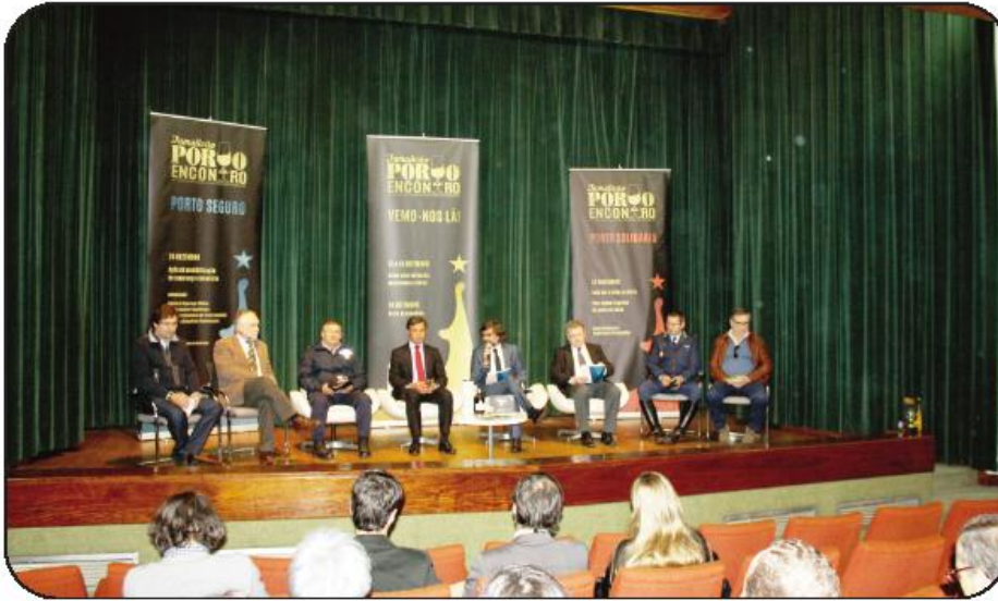
Evento foi apresentado na Fundação Cupertino de Miranda

Esta primeira edição do “Famalicão Porto de Encontro”, agendada para o final de