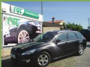
PEUGEOT 508 SW 1.6E-HDI ACTIVE 2012 VARIAS UNIDADES EM STOCK

Oferta de 250 litros em combustível na compra de uma viatura