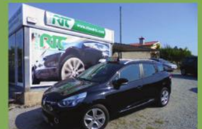
RENAULT CLIO SPORT TOURER 1.5 DCI DYNAMIQUE S 90CV 2013