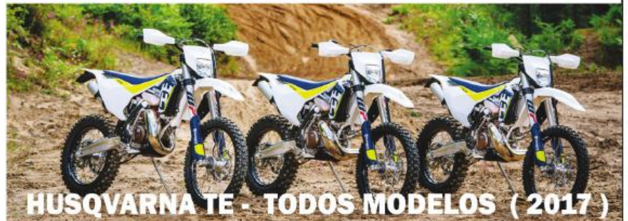
HUSQVARNA TE - TODOS MODELOS (2017)

Rua da Liberdade n.º 146 Calendário 4760-307 V.N.Famalicão (junto à PSP) | TLF.: 252 318 084 | TLM.: 914 713 044 / 914 559 352 | Email: jpm.motos@sapo.pt