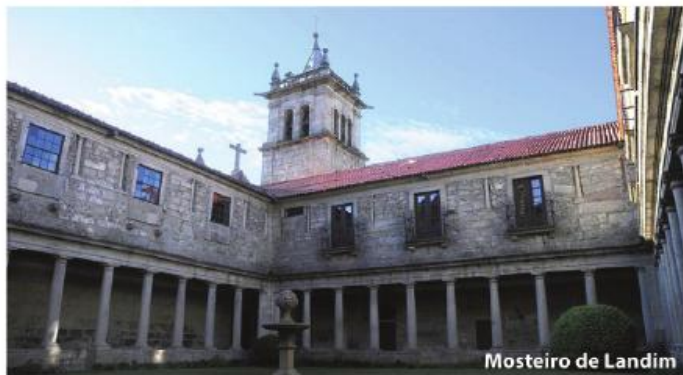
Mosteiro de Landim

VISEITE A NOSSA FEIRA SEMANAL ÀS TERÇAS-FEIRAS