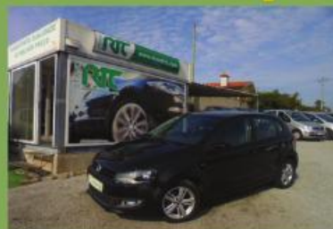
VW POLO 1.2 MATCH 2013 VARIAS UNIDADES EM STOCK