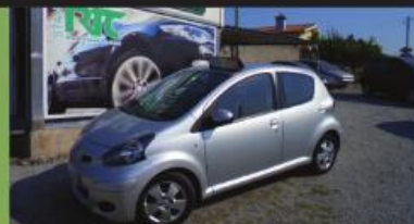
TOYOTA AYGO 1.0 STYLE PACK 33000KM 2011