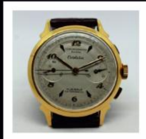
Omega Constellation Corda Automática