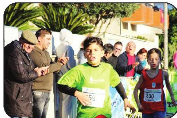
raram na organização da 14.ª S. Silvestre da Juventude.

A Associação Desportiva de Castelões agradece o apoio das entidades oficiais, ao Centro Social de Castelões, aos patrocinadores, empresas e comércio da região e a todos quantos colabo-