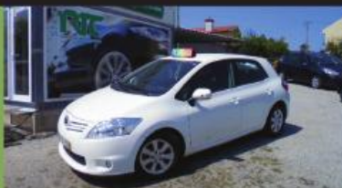
TOYOTA AURIS 1.4 D-4D EXCLUSIVE 90CV 2012 C/ GPS