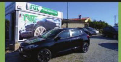
RENAULT MEGANE 1.5 DCI DYNAMIQUE S 2014 VARIAS UNIDADES E CORES EM STOCK

Estrada Nacional 204 / 5, Avidos Famalicão | telf/fax - 252 327 539, tel - 917 610 006 / 914 159 751