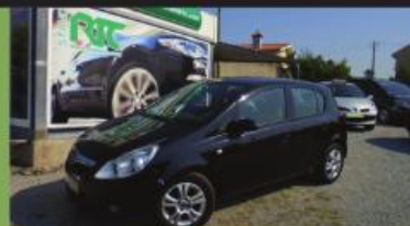
OPEL CORSA 1.2 ENJOY EASYTRONIC 85CV 2010