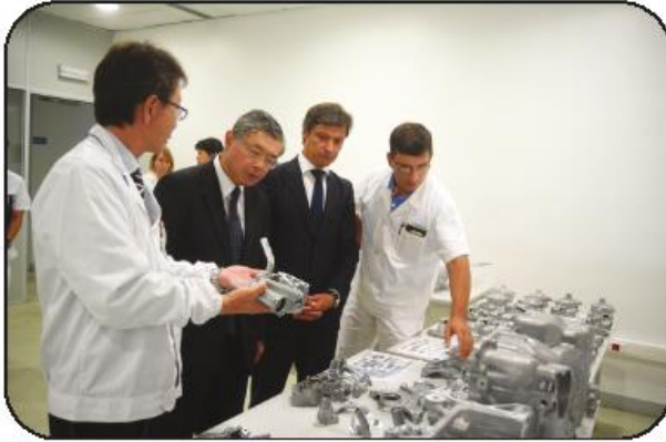
De passagem por Famalicão visitou a "Tesco", empresa de capital 100% japonês

O diplomata não poupou nas palavras para descrever um concelho que diz conhecer pelas suas "grandes empresas". "Exemplos de capacidade exportadora que alia qualidade industrial à inovação e à criatividade na cadeia de valor", disse, referindo-se ainda às empresas famalicenses já presentes no