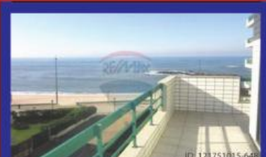
T4 Primeira Linha garagem 2 carros P. Varzim 325.000 €

Prende vender o seu imóvel? Contacte-me, este espaço pode ser seu!