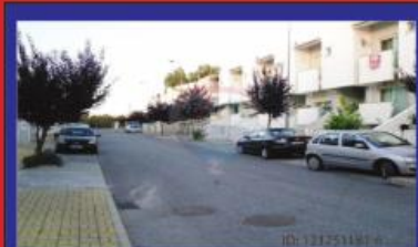
Moradia T3 Gondifelos 115.000€

Refira-se que esta Associação é a entidade promotora do Laurus Nobilis Music Famalicão.