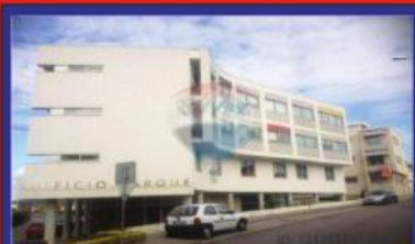
T3 garagem 2 carros Ribeirão 89.900€