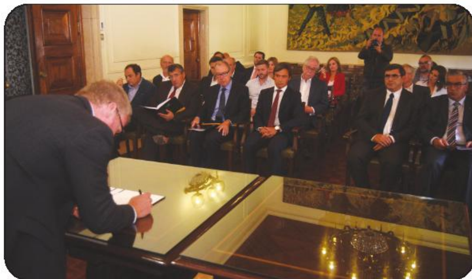
Parceria formalizada em cerimónia realizada nos Paços do Concelho

Esclarece, todavia, que “não estamos a sonhar com um edifício, mas com uma valência”. Ou seja, o CCASC tem condições que avançar no imediato através da articulação das valências já existentes, distintas e complementares, dos vários organismos parceiros neste processo, colocando-as ao serviço do setor. O intuito do município não é o de criar mais uma estrutura, por vezes duplicando valências que já existem: “nós temos é que saber aproveitar as competências, os espaços, as valências que já existem. Por exemplo, se a UTAD ou a Faculdade de Tec-