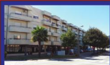
T4 Vermoim c/ garagem muito central 98.000 €