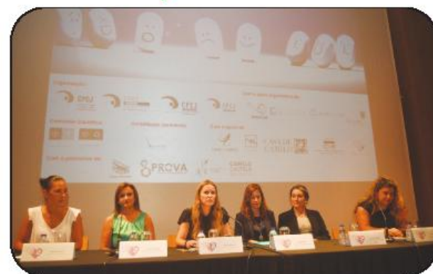
Evento foi apresentado na Casa das Artes, onde irá ter lugar

As inscrições estão abertas e podem ser formalizadas em http://2cipcj.wixsite.com/2016 , endereço onde consta, de resto, a versão integral do programa. Com o processo ainda a decorrer, Dulce Couto espera que as expectativas venham a ser superadas relativamente à primeira edição, realizada há dois anos em Esposende. Dessa vez o Congresso contou com cerca de 400 participantes, número que "esperamos que venha a