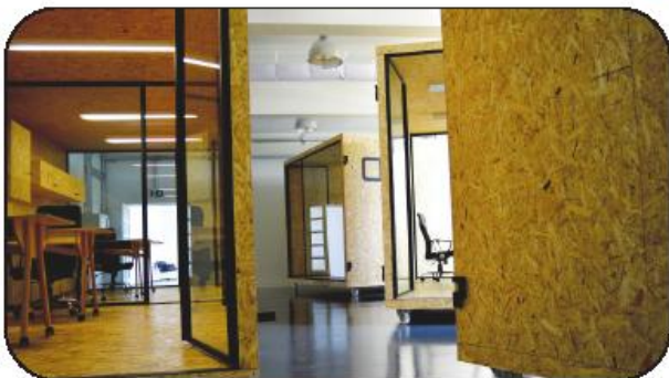
Primeira incubadora nasceu na Riopele

Os objetivos dirigem-se ao aconselhamento das incubadoras da Câmara Municipal e do CITEVE na definição de estratégias para o desenvolvimento de serviços de incubação e de aceleração de startups. Ainda, apoiar a planificação das atividades das incubadoras e proporcionar à comunidade serviços de maior valor acrescentado nas áreas técnicas, tecnológicas e de apoio empresarial.