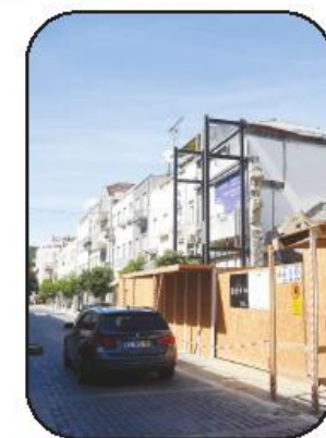
Obras custaram cerca de seis mil euros

O desabamento do prédio ocorreu na sequência de obras de construção de um