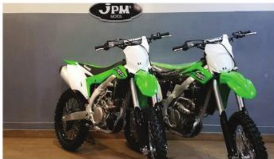
KXF - 250 / 450 ( 2016 )