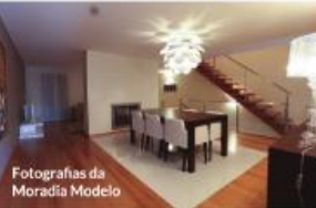
Fotografias da Moradia Modelo

Moradías T3 de luxo, localizadas na Urbanização designada por “Pinhaís de Seda” em Cavalões - Famalicão, de único acesso, fácil estacionamento, rodeada de amplos espaços verdes, com espaços de lazer, local soalheiro e muito sossegado. Proximidades a 5 minutos do centro da cidade de Famalicão, 10 minutos da Praia - P. Varzim, e a 15 minutos do Porto.