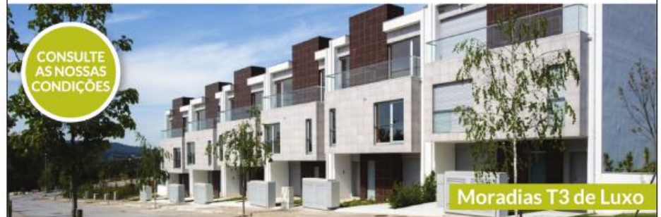
Moradías T3 de Luxo

Moradías T3 de luxo, localizadas na Urbanização designada por “Pinhaís de Seda” em Cavalões - Famalicão, de único acesso, fácil estacionamento, rodeada de amplos espaços verdes, com espaços de lazer, local soalheiro e muito sossegado. Proximidades a 5 minutos do centro da cidade de Famalicão, 10 minutos da Praia - P. Varzim, e a 15 minutos do Porto.