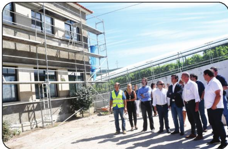
Obras estarão concluídas a tempo do início do ano letivo

O edil famalicense fala de uma intervenção em Requião que não é meramente estética, mas que irá garantir “boa utilização das salas de aulas e de todas as áreas,