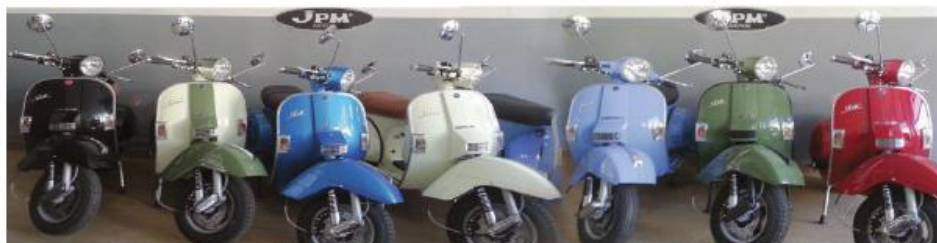
LML - 125 NOVAS, ENTREGA IMEDIATA DESDE 2.049 €

Rua da Liberdade n.º 146 Calendário 4760-307 V.N.Famalicão ( junto à PSP ) | TLF.: 252 318 084 | TLM.: 914 713 044 / 914 559 352 | Email: jpm.motos@sapo.pt