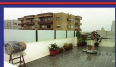
T1 c/ terraço Vistas de mar 88.000€