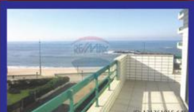
T4 Primeira Linha garagem 2 carros 325.000 €

Prentende vender o seu imóvel? Contacte-me, este espaço pode ser seu!