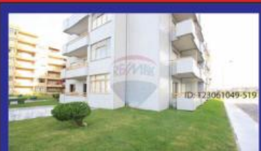
T3 C/ Garagem 132.500€