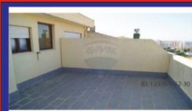
T2 Duplex 89.900€