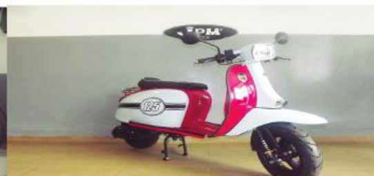
Scomadi 50 / 125 várias cores, desde 1.745 €