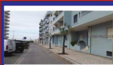
T2 com terraço 135.000€