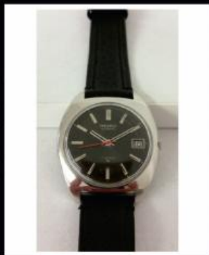
Relógio Pulso Seiko Automático