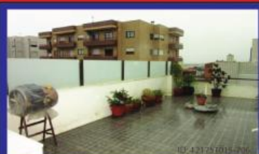
T1 c/ terraço - P. Varzim Vistas de mar 88.000€