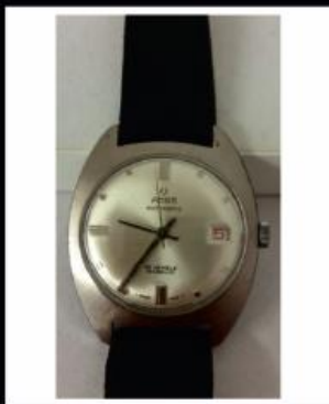
Relógio Pulso Amer Automático