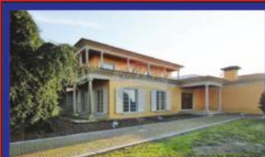
Moradia de Sonho, Lousado 695.000€