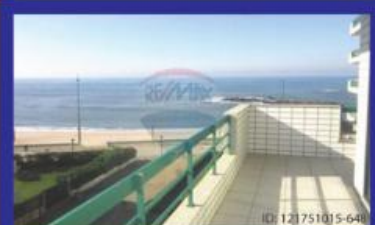
T4 Primeira Linha garagem 2 carros P. Varzim 325.000 €

Prentende vender o seu imóvel? Contacte-me, este espaço pode ser seu!