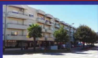
T4 Vermoim c/ garagem muito central 98.000 €