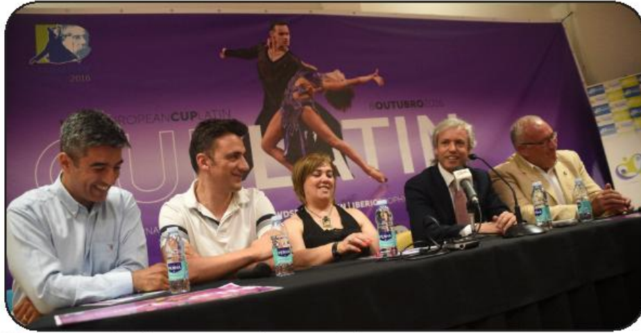
Dirigentes da associação e federativos, com o vereador, a apresentação do evento

O Pavilhão Municipal de Famalicão abre as portas, a 8 de outubro próximo, para uma verdadeira "maratona de dança". Trata-se da terceira edição do Famalicão Dança 2016, uma iniciativa da Associação Gindança com o apoio da Câmara Municipal e das Federações Portuguesa, Espanhola e Europeia.