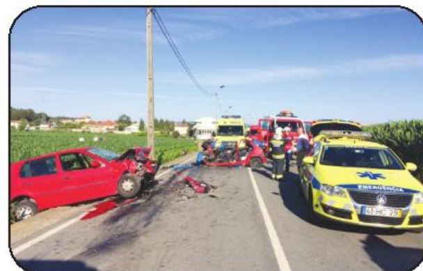
Choque foi de tal forma violento que os veículos ficaram afastados vários metros

de Famalicão, estiveram no local os Bombeiros Famalicenses e da Trofa assim como as ambulâncias de suporte imediato de vida de Santo Tirso e Vila do Conde e a Cruz Vermelha de Ribeirão. A Viatura Médica de Emergência e Reanimação (VMER) do hospital de Famalicão