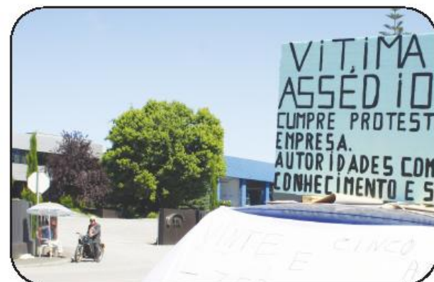
Trabalhador mantém-se à porta da empresa em protesto

Entretanto, para além deste processo disciplinar, o trabalhador em causa tem