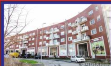
T4 Duplex c/ Terraço Riba d'Ave 90.000€