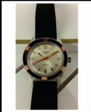
Relógio Pulso Cauny de Corda