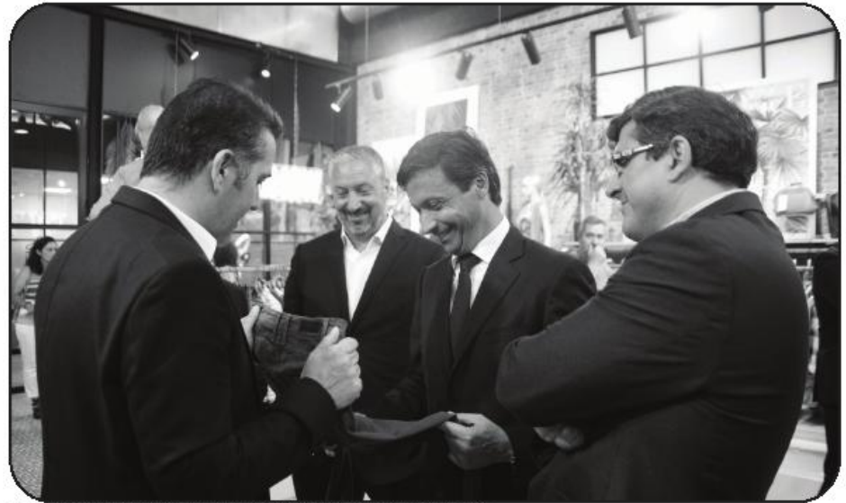
Presidente tomou contacto com novo modelo de calça, em breve no mercado

O presidente da Câmara Municipal mostrou-se particularmente satisfeito com o inconformismo do projeto empresarial, apostado em arrojarse em novas áreas, e deixou claro que é esta “tenacidade, resiliência e resistência” dos empresários que permitiu ultrapassar crises diversas do setor, e sobreviver através do paradigma da qualidade. “Não há setor mais preparado para crises do que o têxtil”, disse mesmo a propósito, aludindo