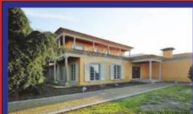
Morada de Sonho, Lousado 695.000€