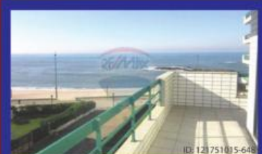
T4 Primeira Linha garagem 2 carros P. Varzim 325.000 €

Prende vender o seu imóvel? Contacte-me, este espaço pode ser seu!