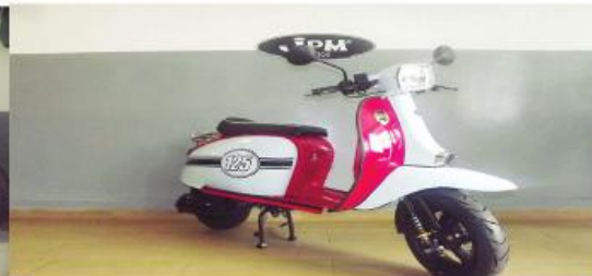
Scomadi 50 / 125 várias cores, desde 1.745 €