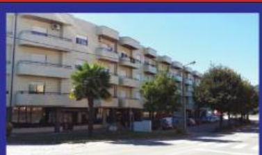
T4 Vermoim c/ garagem muito central 98.000 €