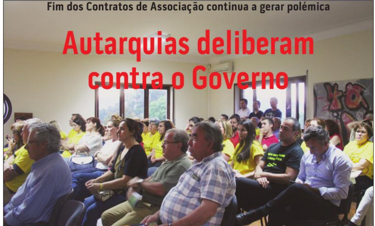
Fim dos Contratos de Associação continua a gerar polémica