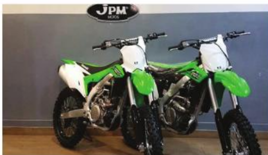
KXF - 250 / 450 ( 2016 )