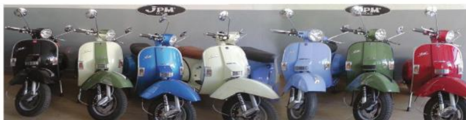
LML - 125 NOVAS, ENTREGA IMEDIATA DESDE 2.049 €

Rua da Liberdade n.º 146 Calendário 4760-307 V.N.Famalicão ( junto à PSP ) | TLF.: 252 318 084 | TLM.: 914 713 044 / 914 559 352 | Email: jpm.motos@sapo.pt