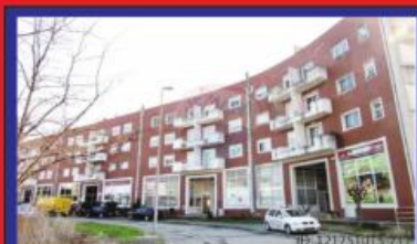
T4 Duplex c/ Terraço Riba d'Ave 90.000€