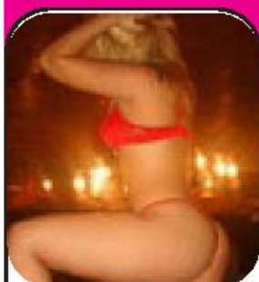
1.ª VEZ EM FAMALICÃO

Jovem madeirense, quente, muito peluda, sexy, adoro anal, beijar na boca, um bom mi... vem namorar sem tempo limite.