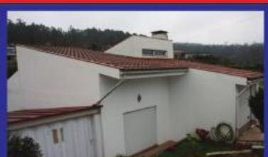
Morada T3 Arnos S. Maria 120.000€