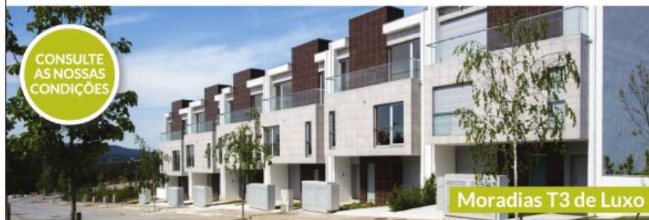
Moradias T3 de Luxo

Moradias T3 de luxo, localizadas na Urbanização designada por "Pinhais de Seda" em Cavalões - Famalicão, de único acesso, fácil estacionamento, rodeada de amplos espaços verdes, com espaços de lazer, local soalheiro e muito sossegado. Proximidades a 5 minutos do centro da cidade de Famalicão, 10 minutos da Praia - P. Varzim, e a 15 minutos do Porto.