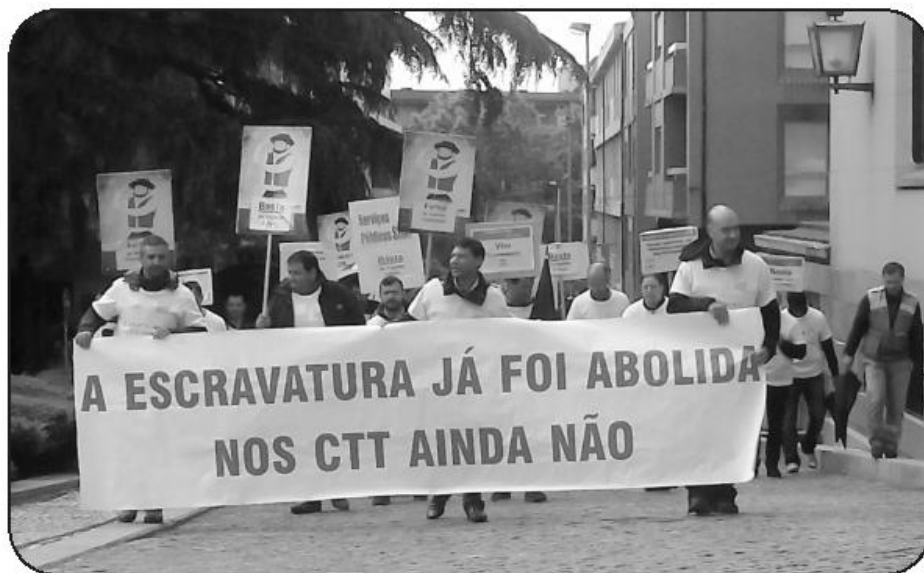
Concentração teve lugar em frente à ACT, seguindo a marcha para os Paços do Concelho

O grupo marchou pelas ruas da cidade até à sede da Autoridade para as Condições de Trabalho (ACT), e depois para os Passos do Concelho, onde foi recebido pelo presi-