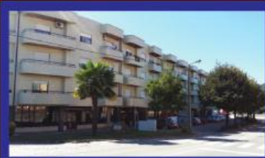
T4 Vermoim c/ garagem muito central 98.000 €