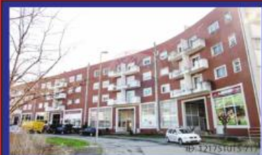
T4 Duplex c/ Terraço Riba d'Ave 90.000€