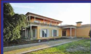
Morada de Sonho, Lousado 695.000€