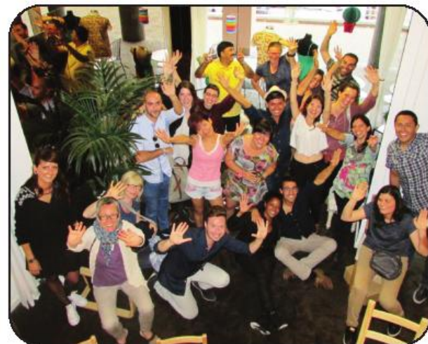
na área do voluntariado internacional".

O projeto QuNeCo foi avaliado como "extremamente positivo e crucial para a promoção do voluntariado europeu e internacional junto dos jovens e permitiu às organizações envolvidas a criação de uma parceria sólida e sustentada por boas práticas de envio, acolhimento e mentoria