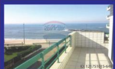
T4 Primeira Linha garagem 2 carros P. Varzim 325.000 €