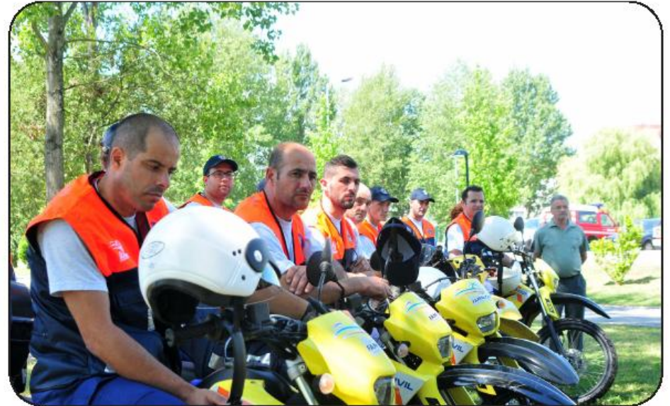
Três equipas móveis de dois elementos cada, mais quatro elementos fixos nas torres de vigia reforçam prevenção

O esquema de vigilância engloba três equipas de vigilância móvel de dois elementos cada. Os restantes elementos afetos à vigilância fixa