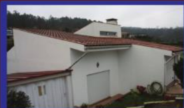
Morada T3 Arnoso S. Maria 120.000€