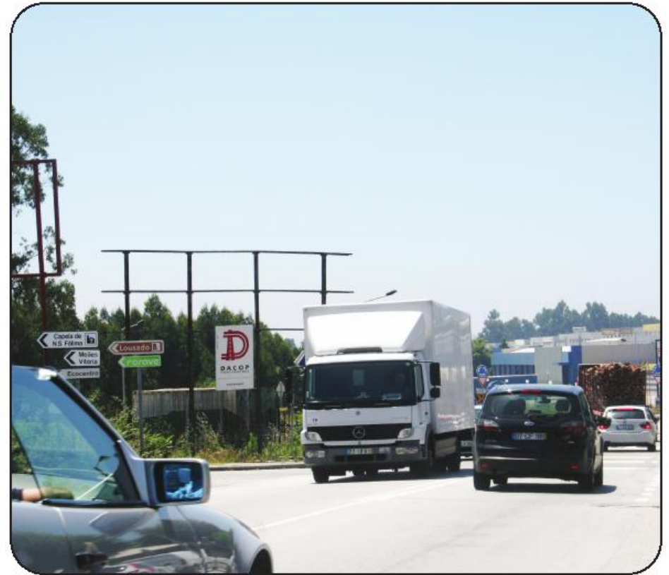
Congestionamento na EN 14 é "tradição", especialmente a determinadas horas do dia

O edil famalicense lembra que a solução apresentada, da ordem dos 36 milhões de euros, "significa 20 por cento da solução inicial" – referindo-se ao projeto de Variante orçada em 200 milhões de euros. Desvaloriza a componente orçamental invocada como