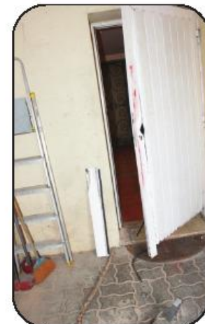
Assaltantes entraram por uma porta das traseiras