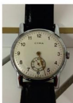
Relógio Pulso Cyma de Coroa