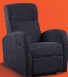
HOME Cadeira Relax