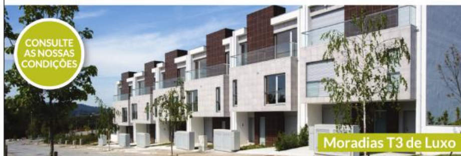
Moradias T3 de Luxo

Moradias T3 de luxo, localizadas na Urbanização designada por "Pinhaís de Seda" em Cavalões - Famalicão, de único acesso, fácil estacionamento, rodeada de amplos espaços verdes, com espaços de lazer, local soalheiro e muito sossegado. Proximidades a 5 minutos do centro da cidade de Famalicão, 10 minutos da Praia - P. Varzim, e a 15 minutos do Porto.