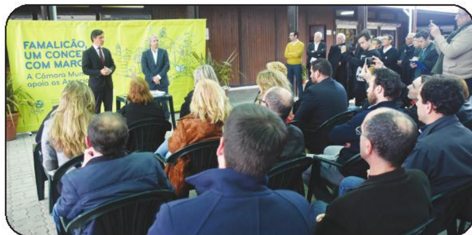
Cedência foi formalizada na semana passada

Na cerimónia de assinatura do protocolo de cedência do espaço, o edil famalicense referiu que mais do que representar um momento