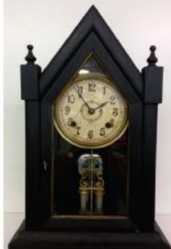
Relógio de Mesa Capela