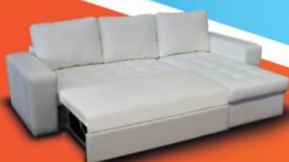
BAIONA Chaiselongue com cama