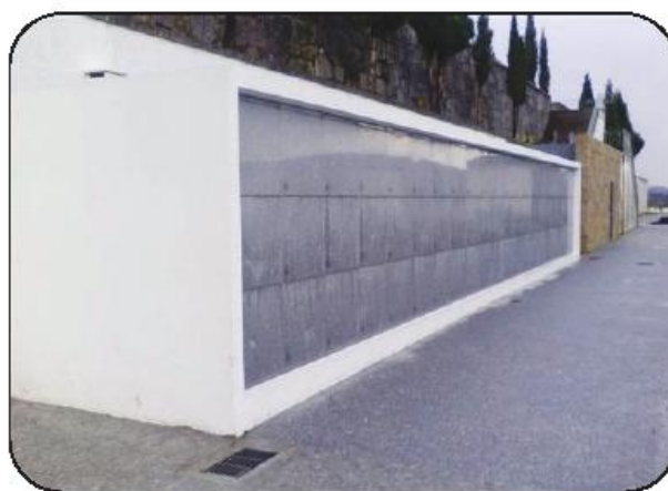
Uma das mais de 200 obras que a empresa já efetuou pelo país

Para garantir a fiabilidade das construções, a "Beira Cruz" desenvolveu um filtro próprio, que permite a entrada e saída de ar dos gavetões. O que tem encontrado são filtros de saída de ar, apenas, "excluindo o fator circulação, impede-se que ocorra o processo de decomposição", adverte, acrescentando que as construções também só contemplam uma rede de tubagem, para líquidos e gases, quando o "Sistema Beiracorvo" prevê a separação de ambos, e encaminhamento de líquidos para depósitos estanques, onde procede à manutenção com regularidade.