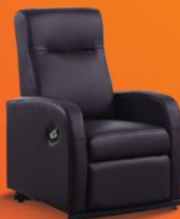
TRADE Cadeira Relax