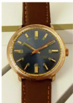
Relógio Pulso Couny de Coroa