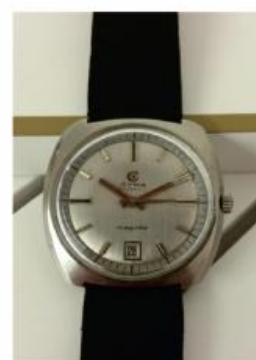
Relógio Pulso Cyma Automático