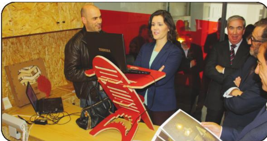
Líder do CDS visitou cinco start-ups da Incubadora Made IN e pôs mesmo à prova algumas das propostas inovadoras

Surpreendida pela qualidade dos projetos empresariais instalados na Incubadora "Made IN", Assunção Cristas elogiou o forte aposta na inovação, de gente "muito motivada". Disse mesmo que "é disto que o país precisa: de inovação, trabalho, afínco, com os municípios também a puxar, porque é isto que vai