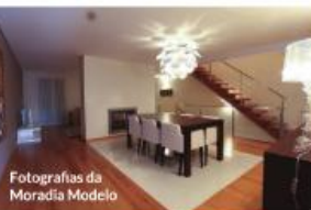
Fotografias da Moradia Modelo

Moradias T3 de luxo, localizadas na Urbanização designada por "Pinhaís de Seda" em Cavalões - Famalicão, de único acesso, fácil estacionamento, rodeada de amplos espaços verdes, com espaços de lazer, local soalheiro e muito sossegado. Proximidades a 5 minutos do centro da cidade de Famalicão, 10 minutos da Praia - P. Varzim, e a 15 minutos do Porto.