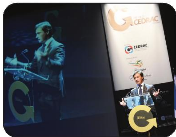
Grande Auditório encheu-se para a entrega de prémios CEDRAC

Falando para um auditório repleto de empresários, o edil referiu-se ao concelho de Famalicão no sentido da sua afirmação como "contribuinte líquido para o sucesso do país, destacando-se como terceiro concelho mais exportador e o segundo com maior saldo líquido da balança comercial".