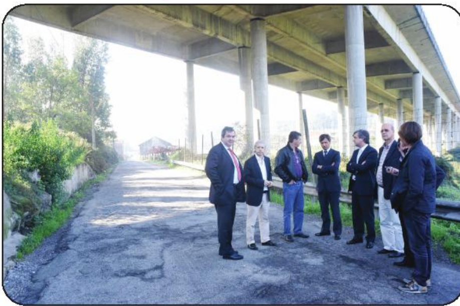
Autarcas visitaram as vias que vão ser intervenionadas

Para além do benefício direto das populações, que reconhece que têm sofrido com o mau estado do piso, o edil famalicense fala de vantagens para a dinâmica empresarial do território concelhio. “Famalicão é um concelho com uma marca empresarial muito forte, e nós também queremos que estas vias, que vão ser reabilitadas, sirvam como estímulo para que empresas possam sedear os seus negócios e desenvolver cá os seus projetos. Estas vias, para além de servir as pessoas, também servem de estímulo e são um sinal claro que a Câmara Municipal quer