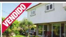
Morada - Lemenhe