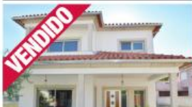
Morada - Vilarinho Cambas

Esmeriz Apartamento T2 com garagem fechada para 2 carros. Perto da cidade. KW212153 // 75.000 €