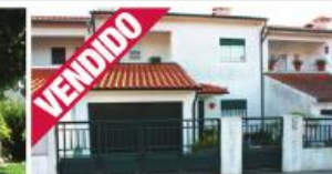
Morada - Cruz