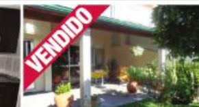
Morada - Còvelo