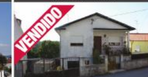
Morada - Antas