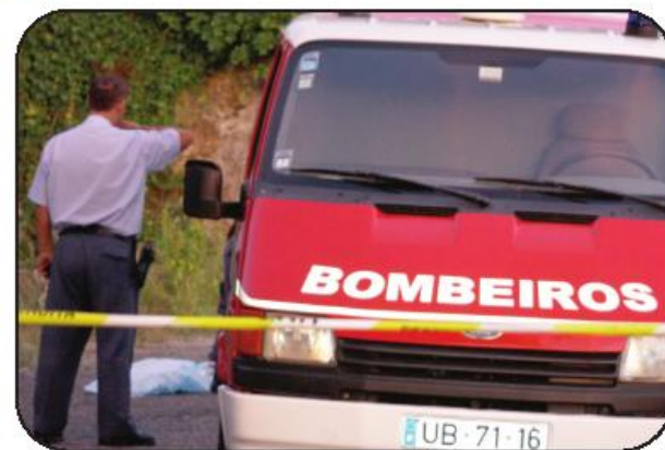
Acidente teve lugar em setembro de 2013