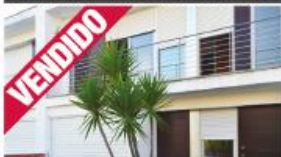
Morada - Ribeirão