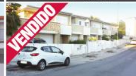
Morada - Antas