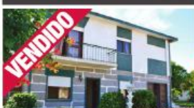
Morada - Gavião

Calendário Apartamento T1 no centro, com boas áreas, óptima exposição solar. KW213001 // 63.000 €