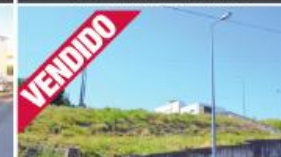
Airão, Guimarães - Terreno