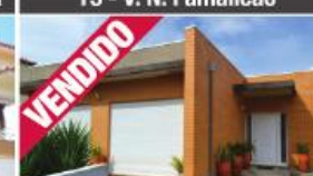
Morada - Lemenhe