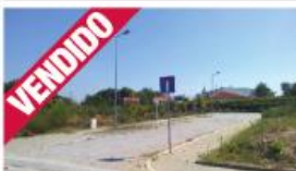
Terreno - Areias

Cruz Excelente Quinta com 2 casas para recuperar, com 10.697 m2. KW212335 // 220.000 €