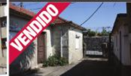
Morada - Avidos