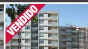
T3 - V. N. Famalicão