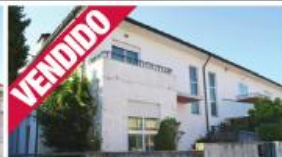
Morada - Requião