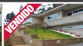
Morada - Armoso Stª. Eulália