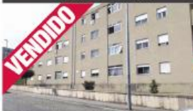
T3 - Calendário