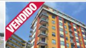
T2 - V. N. Famalicão