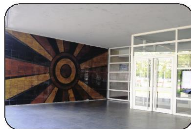
de divulgação, de diálogo e de definição de novos rumos para as bibliotecas da atualidade.

Este encontro, acreditado pelo Conselho Científico do Centro de Formação de Associação de Escolas de Vila Nova de Famalicão, pretende, assim, assumir-se como um espaço de partilha,