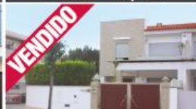
Morada - Avidos