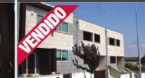
Morada - Ribeirão