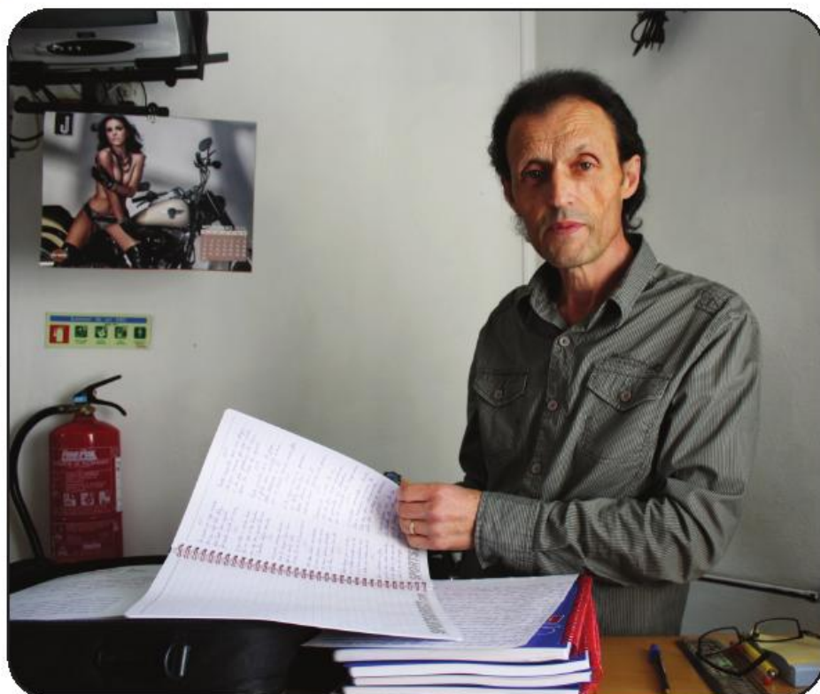
Escritor tem várias obras prontas a editar

Oliveira é já uma referência no panorama editorial. Isso mesmo justificou o convite da Chiado Editora, de Lisboa, para participar numa Antologia que reúne 1500 poemas de diferentes autores. O autor radicado em Famalicão assina um dos poemas dessa compilação, apresentada em março de 2015 em Lisboa. Também em março, mas de 2014, participou num concurso de poesia em Cinfães,