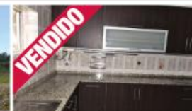
T3 - V. N. Famalicão