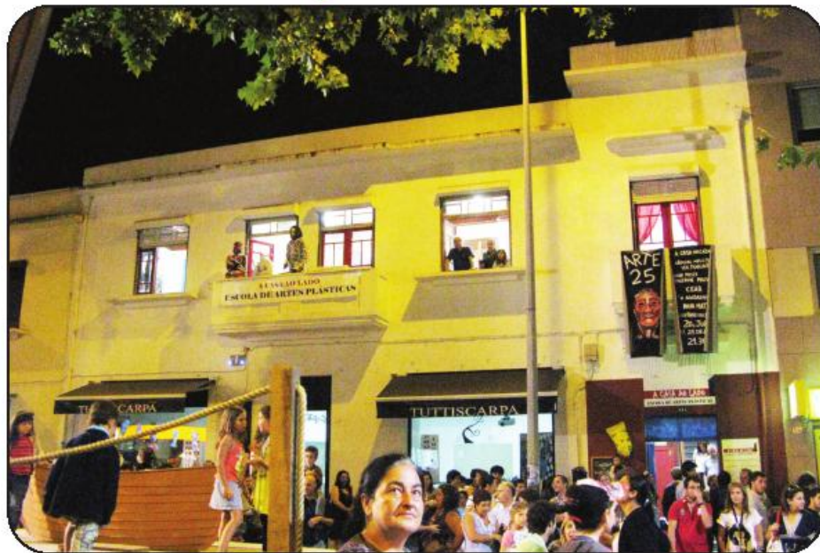
N’ “A Casa ao Lado” não há limites para a criatividade

Inicialmente mais focada nas crianças, hoje em dia a escola funciona essencial-