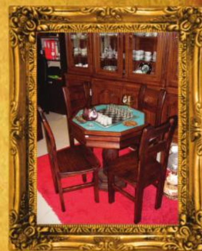
Mesa de Jogo Antiga + 4 Cadeiras