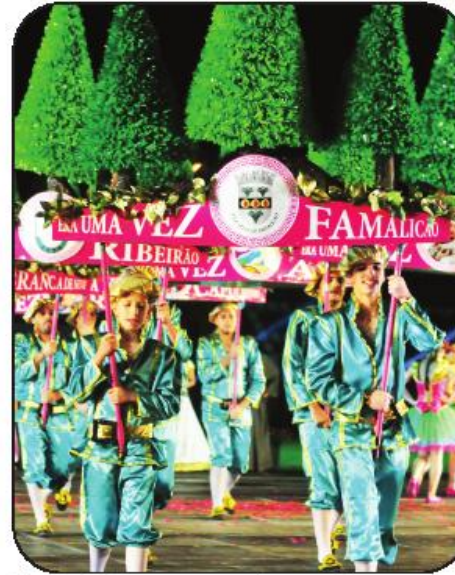
Ribeirão e ARCA, ocuparam o segundo e terceiro lugares, respetivamente

que estreou o curso, tinha avisado que o desfile "não poderia arrancar melhor". Com "uma música e letra inspiradora, um guarda-roupa maravilhoso e uma coreografia digna de vencedores", as gentes de Vilarinho conquistaram a sua primeira grande vitória nas marchas após três participações consecutivas. Caso para dizer que à terceira foi de vez!