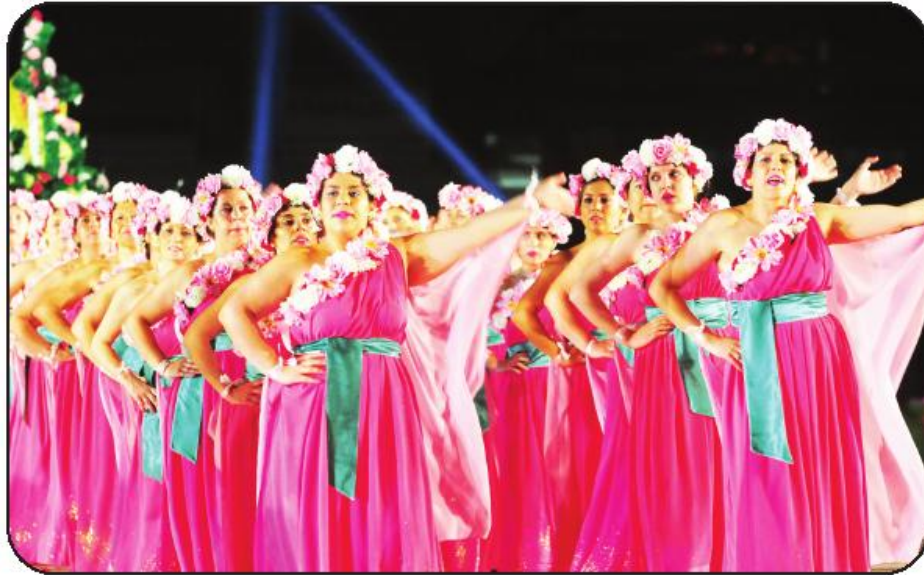
"O Brilho dos Deuses" foi o tema da marcha de Vilarinho, a grande vencedora

A Associação de Pais e Encarregados de Educação de Vilarinho das Cambas foi a grande vencedora da edição deste ano das Marchas Antoninas, com "O Brilho dos Deuses". A formação ganhou o prémio de melhor marcha, à frente do Clube de Cultura e Desporto de Ribeirão, com "Era uma Vez...", e da ARCA - Associação Recreativa e Cultural de Antas, com a "Arca dos Sonhos", que ficaram