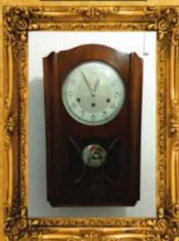
Relógio Camilhão REGULADORA