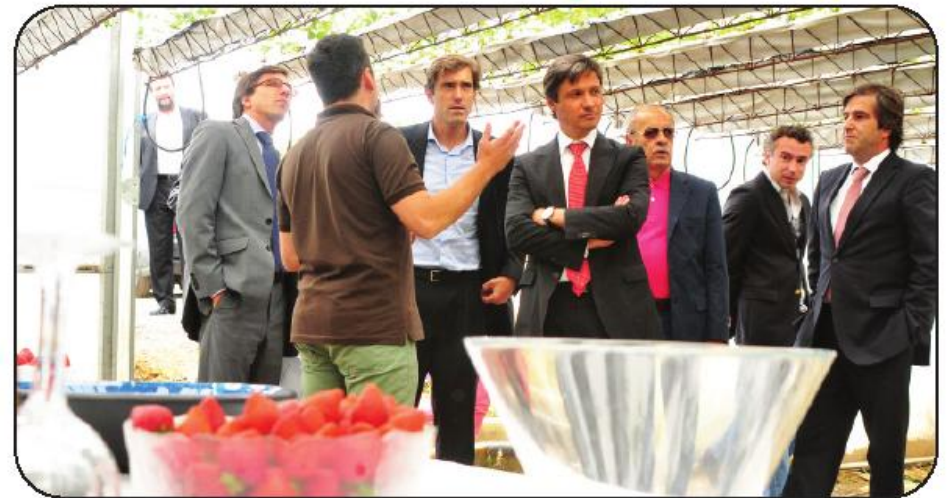
Secretário de Estado visitou exploração e deixou soluções para as dificuldades expressas

Confrontado com a dificuldade do jovem agricultor, José Diogo Albuquerque