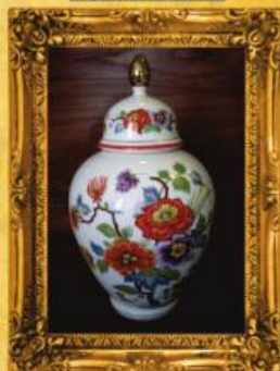
Talha Oriental VISTA ALEGRE