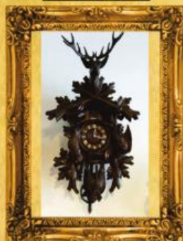
Relógio CUCU REGULADORA