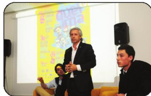
Qualidade programática é também sinal de consolidação das academias, diz o vereador

Estreando o mês de Maio, os "D.A.M.A." são o nome sonante da terceira noite de concertos. A banda, em digressão pelas Queimas das Fitas do país, actua num dia povoado ainda de DJ's vários.