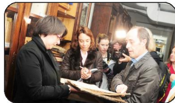
Comitiva passou pelos corredores "secretos" da Biblioteca

rio municipal que conduziu a comitiva pelos recantos mais secretos da Biblioteca Municipal, aguçou o apetite dos visitantes, curiosos por "defeito de profissão", e só mesmo o tempo condicionado fez com que muitas perguntas acabassem por não ser feitas.