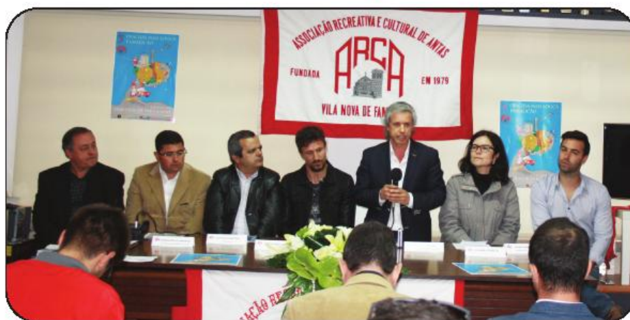
Evento foi apresentado na sede da ARCA, e contou com a presença do vereador do Desporto

O padrinho desta terceira edição é Ukra, conhecido jogador de futebol famalicense. Não hesitou quando convidado, disse, porque para além de famalicense “também tenho uma parte louca