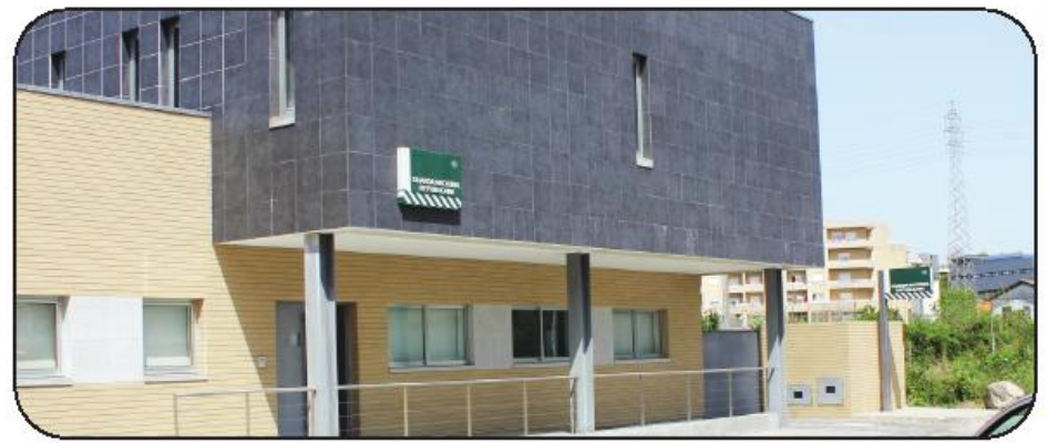
Pai, levou as meninas à GNR, onde as deixou com a respectiva identificação

De igual forma tentámos chegar à fala com os avós,