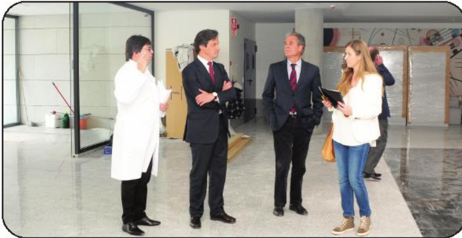
Presidente da Câmara visitou novas instalações, que deverão abrir já em Maio

O Hospital de Riba de Ave, que já se assume como uma referência em matéria de oftalmologia, tem condições de atingir a excelência com a criação de "duas novas unida-