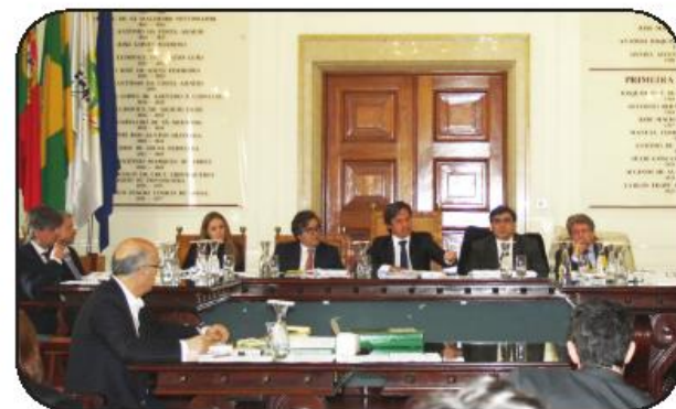
Reunião extraordinária teve lugar na passada quinta-feira

"Por isso, nós não podíamos votar favoravelmente, nem sequer abster-nos, perante um relatório de contas com estes dados, em que aumentou a receita muito à custa do IMI, à custa da tarifa de água mais cara do Quadrilátero, quando todos estes esforços dos famalicenses serviram aumentar a aquisição de bens e serviços e as despesas com pessoal", explicou o vereador, que também desmente o aumento