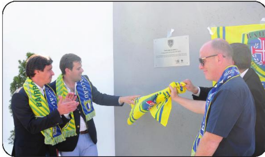
Obra tornou-se possível com envolvimento de instituições e sociedade civil