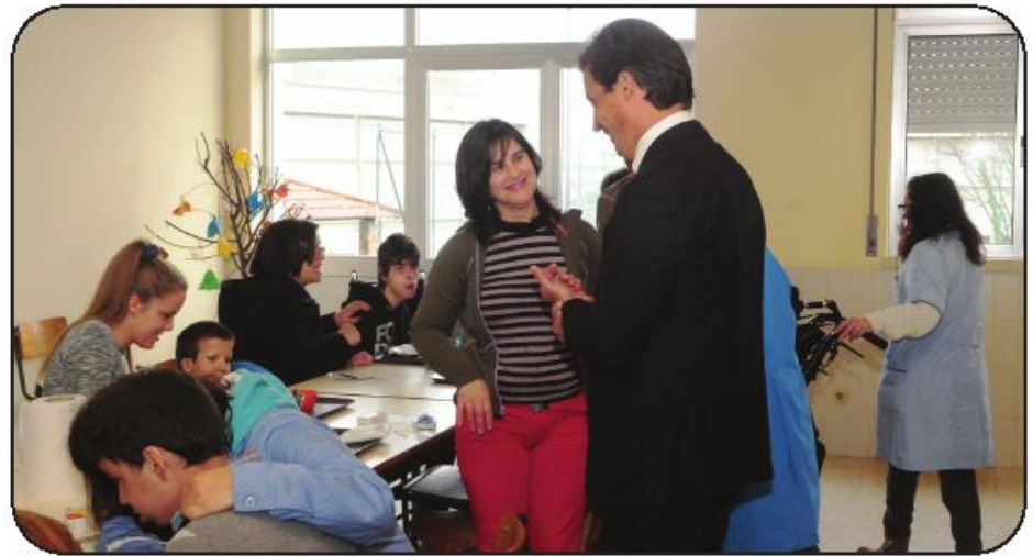
Presidente da Câmara acompanhou algumas das ações em curso

Para o presidente da Câmara Municipal, Paulo Cunha, a concretização deste projeto só é possível graças "ao envolvimento e empenho de toda a comunidade educativa, não só na cedência do espaço, como no acompanhamento ao nível profissional". E acrescenta: "Trata-se de uma boa conjugação de esforços, pois só assim é possível ajudar estas famílias