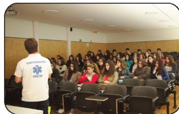
Forma e sensibilizar são os principais objectivos do projecto

A última das ações teve lugar na Escola Secundária da Trofa, com o objetivo de promover o bom relacionamento com as várias enti-