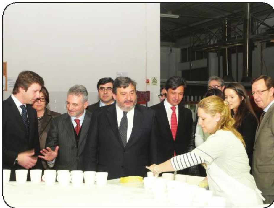
Visita à “Cup & Saucer” deu início à jornada que terminou na “Vieira de Castro”

O edil famalicense transporta este legado para uma agenda municipal que visa gerar mais atractividade, para