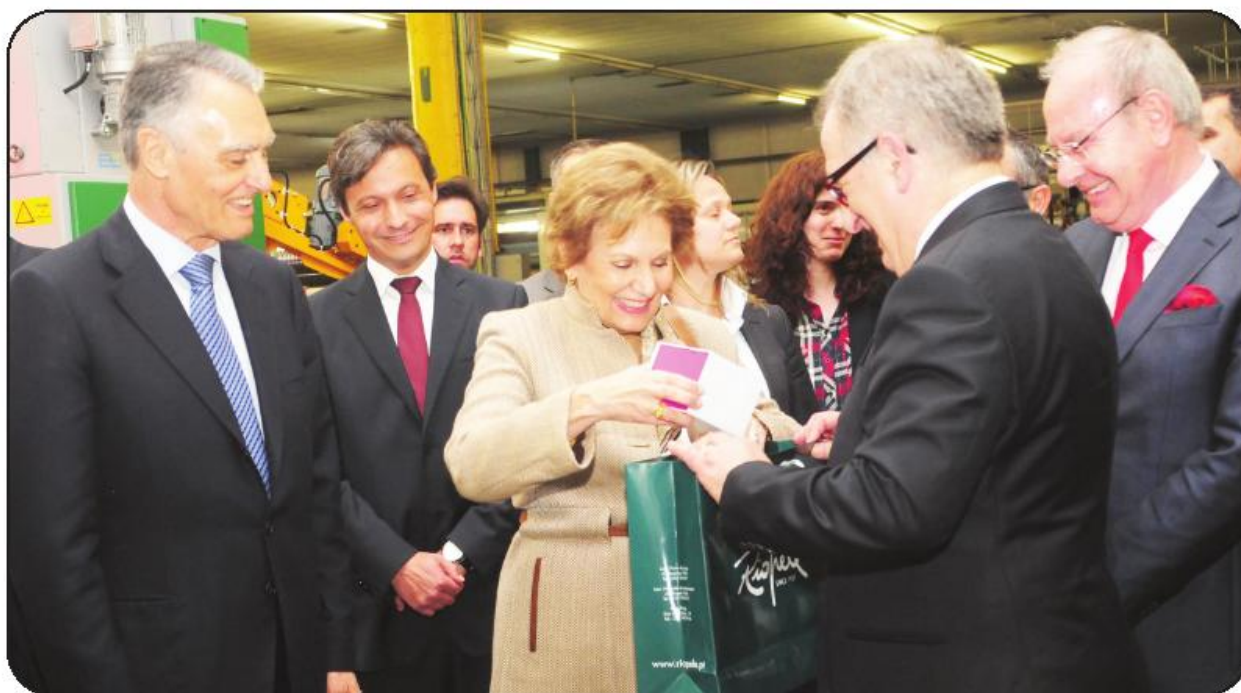
Presidente da República acompanhado de Maria Cavaco Silva na "Riopele"

No Citeve, depois de um dia marcado por visitas a empresas de referência do sector, como a "Riopele" ou a "Scoop", Cavaco Silva falou perante uma plateia de em-