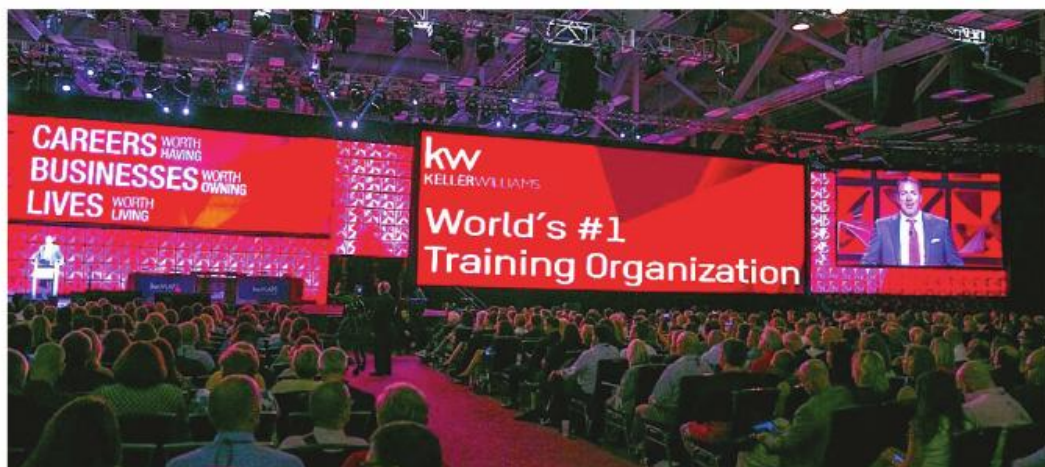
FAMILY REUNION KELLER WILLIAMS EM ORLANDO - EUA.

É este o espírito que reveste toda a equipa de gestão e todos os colaboradores do Grupo Business.