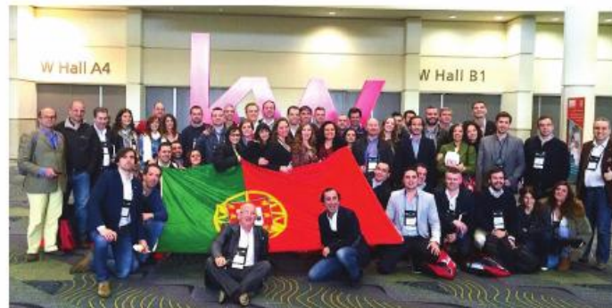
REPRESENTAÇÃO PORTUGUESA NA FAMILY REUNION DA KW EM ORLANDO - EUA.

O proprietário vendedor em Portugal, compreende hoje, que a estratégia de vender a sua casa, contratando em exclusivo uma mediadora para a promoção da mesma, é uma clara vantagem tendo por base saber via contrato, que a sua casa será partilhada no que confere à venda, junto de todas a mediadora imobiliárias em Portugal ou qualquer outro País no mundo.