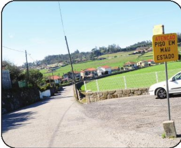
Estrada que liga as freguesias de Abade Vermoim e Lagoa é uma das intervencionadas