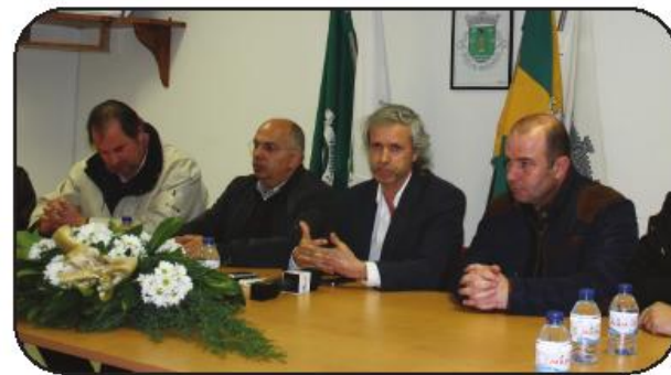
Vereador, acompanhado dos autarcas

ca cicerone da segunda etapa desta crono-escalada, a freguesia de Vermoim, aproveita para elogiar a parceria criada entre vários agentes, mas também a inovação em torno de uma oferta distintas das existentes.