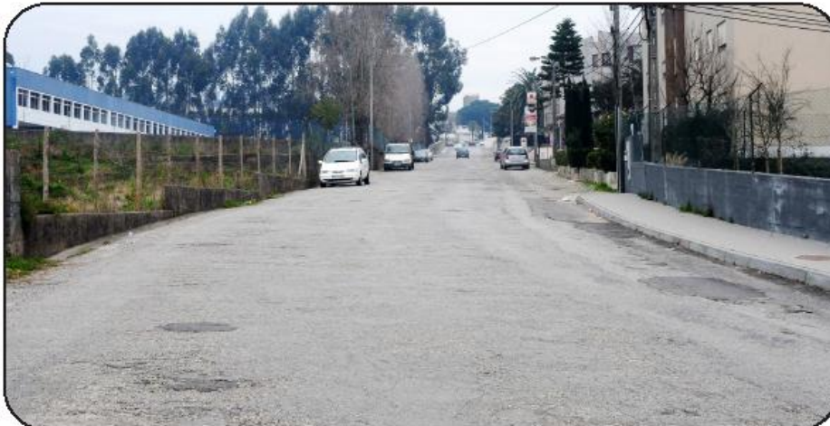
Rua da Roderstein é uma das intervenções

Estas vias de comunicação, com enorme relevância para a atividade empre-