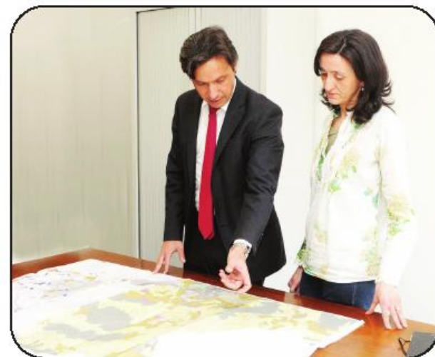
Câmara vai promover sessões públicas de esclarecimento

À semelhança de outros processos que desencadeou desde que tomou posse, o presidente da Câmara adianta que também neste caso pretende que o processo seja participado e transparente. É nesse sentido que terão lugar várias sessões de esclarecimento sobre o PDM nas freguesias, locais para onde será deslocada uma equipa encarregue desmistificar o conteúdo do documento aos cidadãos, potenciando, com isso, contributos informados.