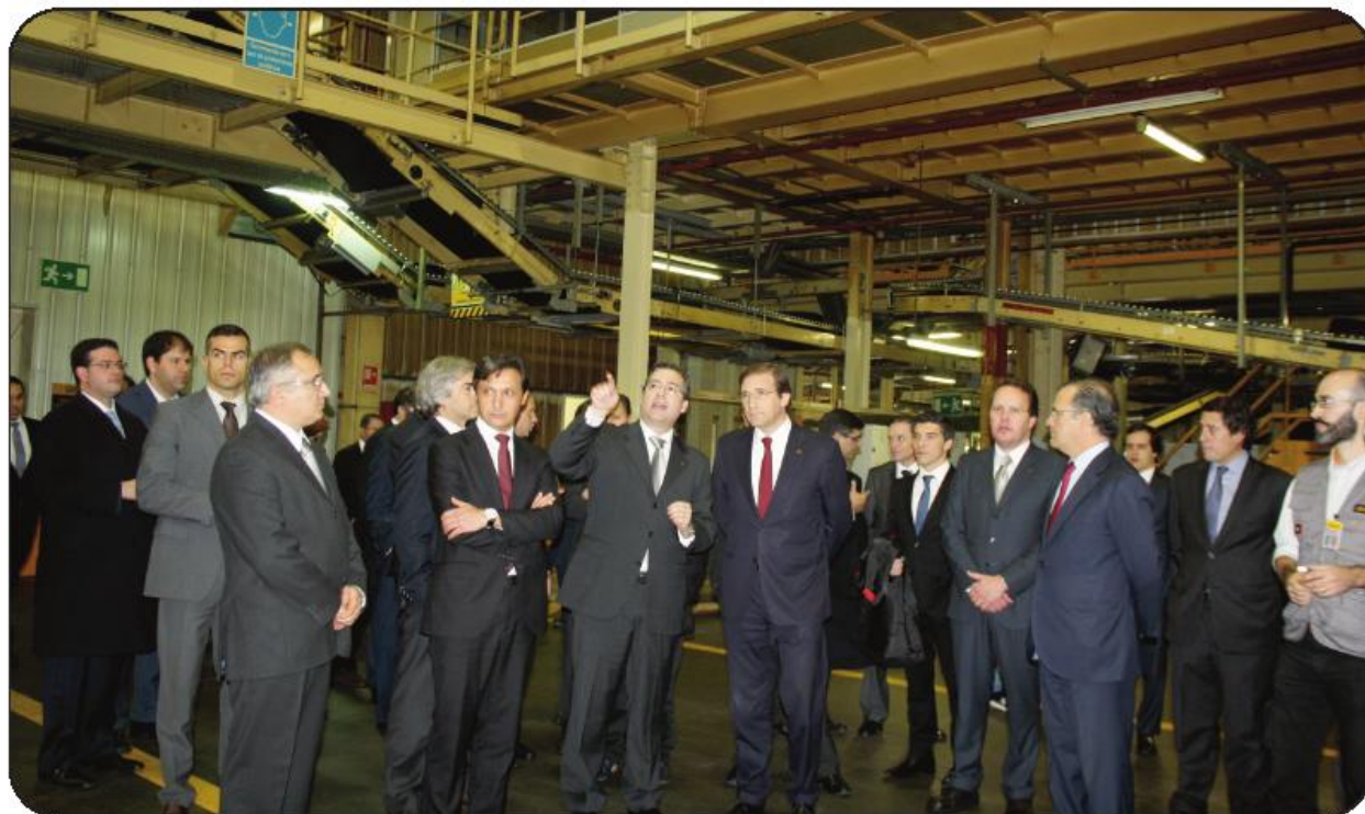
Primeiro-ministro visitou instalações da unidade de Lousado, no contexto do anúncio público da obra

A solução a que agora se chega é, no entender do primeiro-ministro de Portugal,