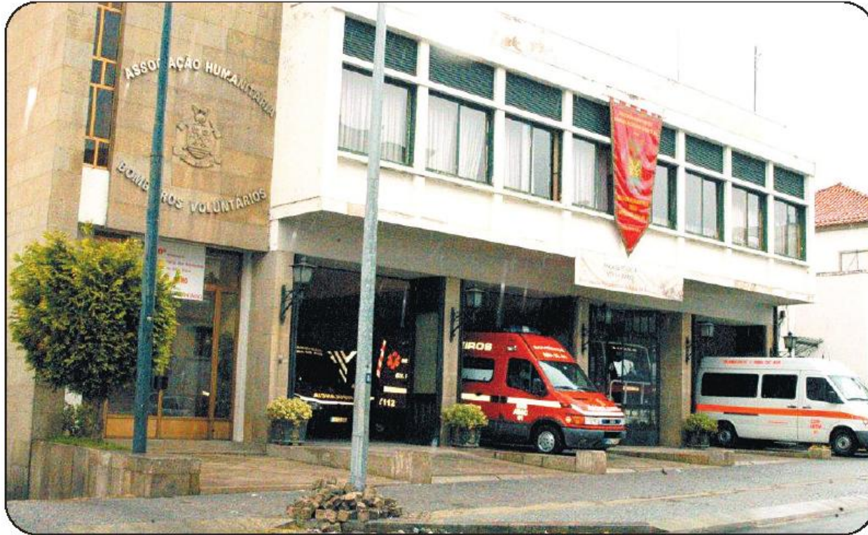
Antigo quartel é activo essencial para financiar novo equipamento, inaugurado em Setembro