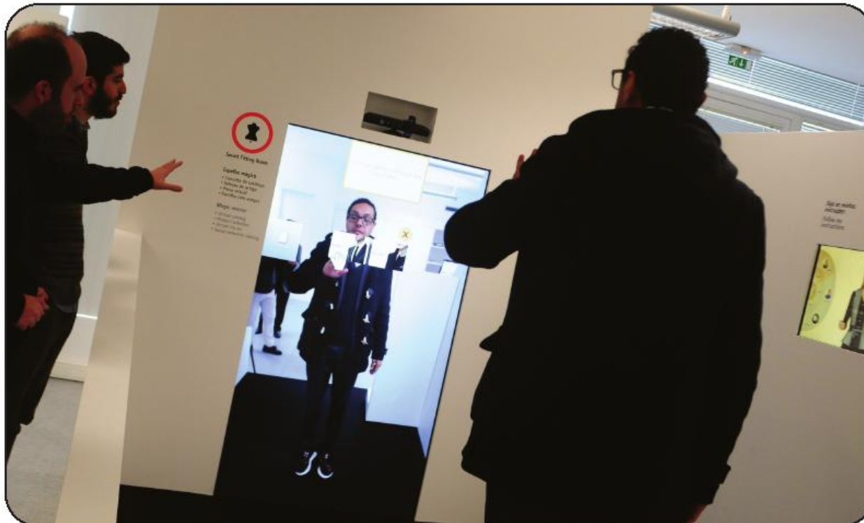
N Loja do Futuro, experimentar roupa não significa, necessariamente, vestir-se

A visita foi promovida pelo Agrupación Europea de Cooperación Territorial (AECT) Galiza-Norte de Portugal, em conjunto com a Associação Têxtil e Vestuário de Portugal (ATP), a Conferación de Indústrias Textiles de Galicia (COINTEGA) e a Câmara Municipal de Vila Nova de Famalicão, tendo compreendido a visita a diversas empresas da região.