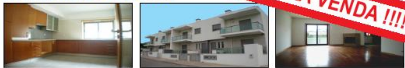
Vivenda nova T3 - Cozinha Mobilada, Armários Embutidos, Garagem para 2 Carros. Sala 40 m2. Quintal/Jardim. Aquecimento Central Completo, Alarme, Soalhos em Madeira Maciça. Excelente Oportunidade