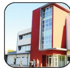
Centro Social de Ribeirão é uma das instituições beneficiadas

instituições a cumprirem os compromissos assumidos aquando das candidaturas apresentadas para a execução dos equipamentos sociais.