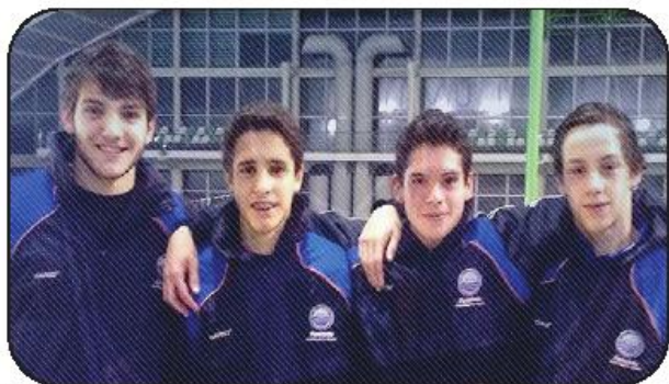
Nadadores bateram recordes em Estafeta 1 e Juvenis