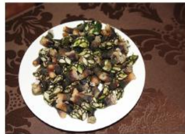
Dose de Perceba - 5€