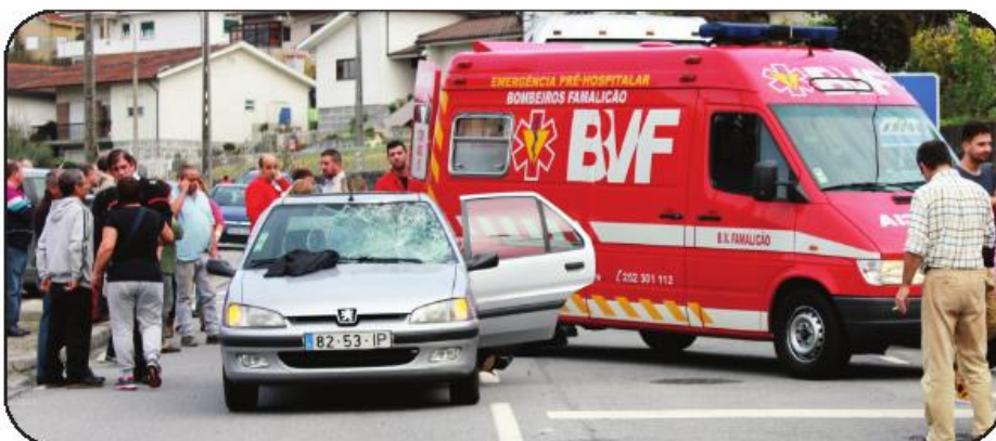
Atropelamento ocorreu quando regressavam a casa do corta-mato

O autocarro suspendeu a marcha na paragem de autocarro existente na Rua do Carvalhal, e os dois irmãos atravessavam a estrada na passadeira, pela parte de trás do pesado de passageiros, quando foram colhidos por um automóvel ligeiro que circulava em sentido oposto. Ao que apurámos no local, o rapaz mais velho foi o mais atingido pelo carro, daí que