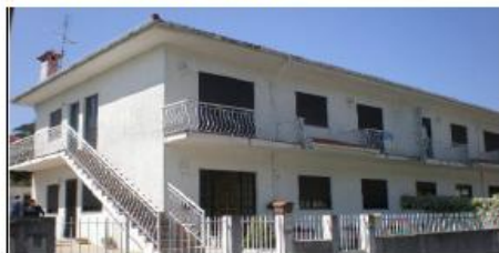
2 Apartamentos T3 Lousado Com Garagens Fechadas COMO NOVOS