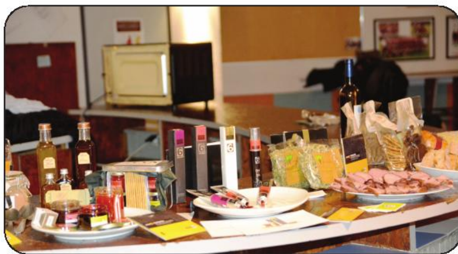
Seminário foi mostra do que de inovador se faz por Vila Nova de Famalicão

Entretanto, num espaço dedicado à troca de experiências e de sabores entre as várias regiões do projeto, o Município de Vila Nova de Famalicão apresentou a toda a delegação europeia o que de melhor se faz em Famalicão na área alimentar e artesanal. A apresentação e degustação dos produtos famalicenses foi um enorme sucesso com os parceiros a ficarem deliciados com a qualidade e inovação dos produtos famalicenses.