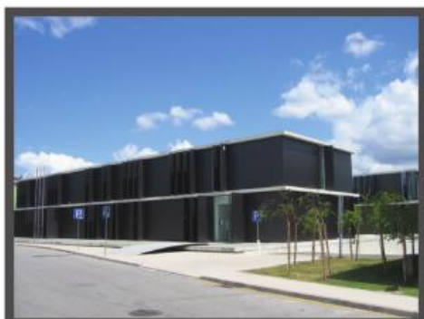
Centro de Saúde de Delães

Bairro Augusto Correia | 4765 - 099 DELÃES | TLF.: 252 932 557