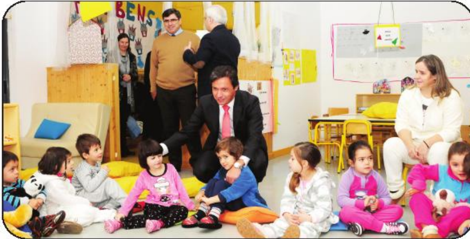
Paulo Cunha falou pôs-se à conversa com as crianças da instituição

Para o presidente da Câmara Municipal, Paulo Cunha, que marcou presença na "Mundos de Vida" no Dia Nacional do Pijama, este é "um programa de âmbito nacional muito interessante, empolgante, convocante e desafiante para a comunidade, onde através do simbolismo do pijama queremos reforçar o valor da família e acima de tudo o direito fundamental –