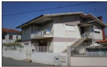
Vivenda T3 Isolada com Jardim Quintal Excelente cozinha Exposição solar- Garagem - Anexos Bom Preço