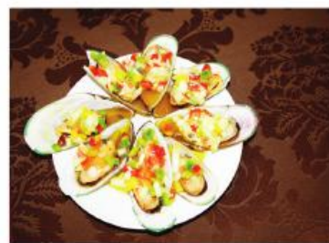
Dose de Mexilhão - 5€