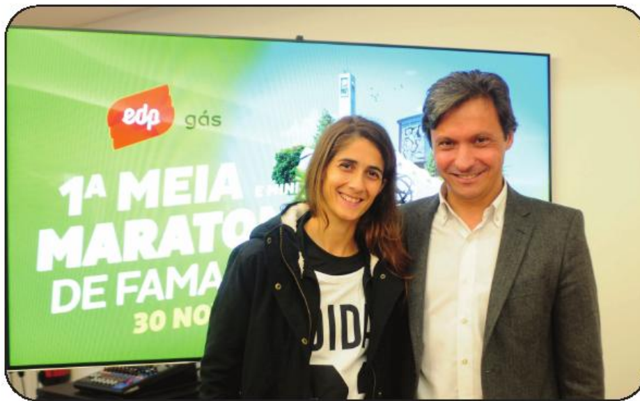
Atleta natural de Roriz, concelho de Santo Tirso, com o presidente da Câmara

O autarca mostrou-se satisfeito pela realização de uma primeira prova do género em solo famalicense, lembrando que "já há muito que a autarquia ambicionava trazer para a cidade a realização de um grande evento