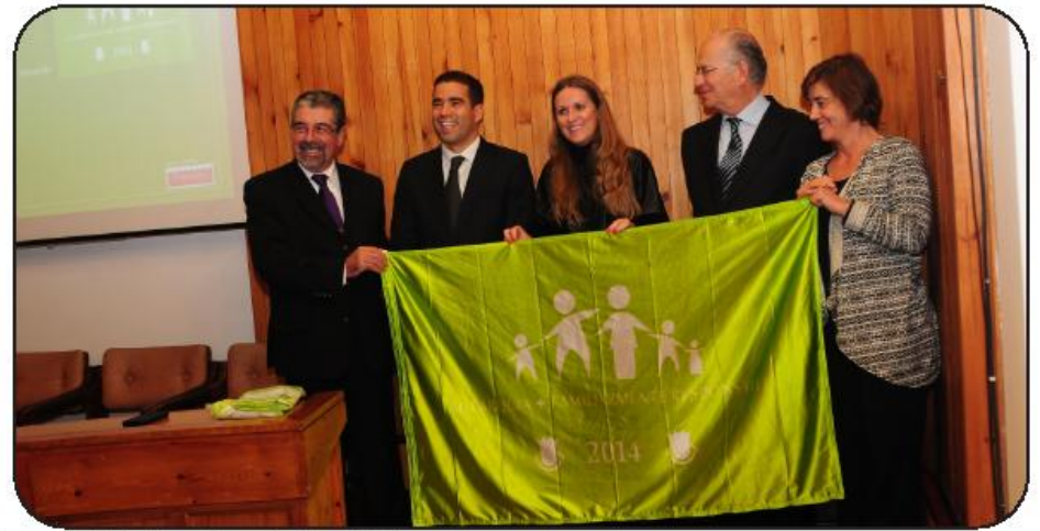
vereadora da Família recebeu o galardão em Coimbra

português felicitou o município famalicense, assim como as restantes 38 autarquias galardoadas, pela distinção recebida. Um reconhecimento pelo trabalho que tem vindo a ser desenvolvido em prol das famílias, que na opinião do governante, apenas é possível quando se mantém uma política de abertura e de proximidade e indo ao encontro das suas necessidades,