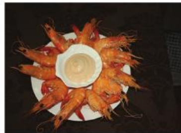
Dose de Camarão - 5€