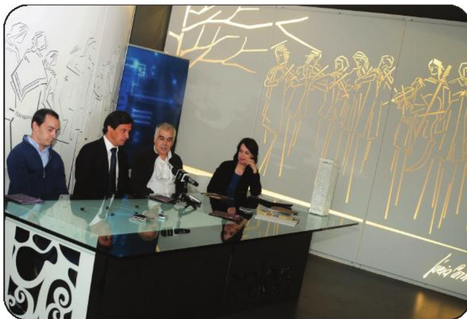
Visita passou pelo show-room da empresa, onde estão algumas peças e painéis expostos

A produção destes painéis e outras peças de mobiliário de interior (por exemplo candeeiros) e exterior (por exemplo jardins) tornou-se possível