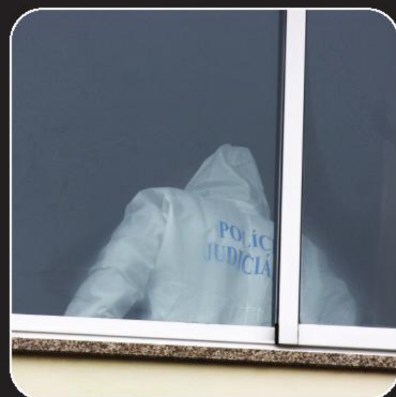
Durante algumas horas a Polícia Judiciária recolheu indícios no interior da casa

A Polícia Judiciária foi chamada ao local para apurar o contexto da morte do homem. Em face dos indícios encontrados, acabou por ser confirmada a tese de suicídio, e não a tese de agressão mortal por parte da companheira agredida, que teve que ser considerada pelas autoridades até desfecho da investigação.