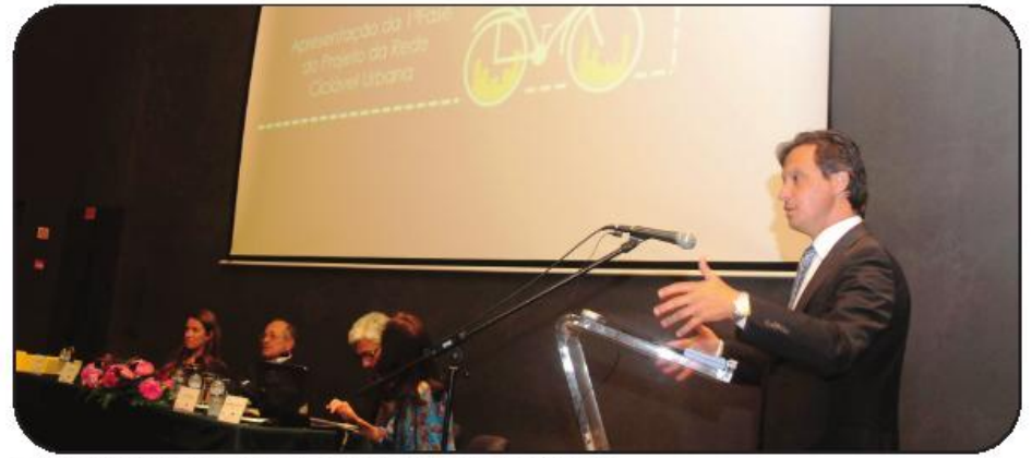
Primeira fase arranca logo que a Câmara tiver parecer da ANSR, garantiu o edil