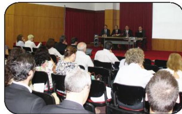
Iniciativa teve lugar na Biblioteca Municipal

Os 400 utentes indagados, sobre a sua percepção dos serviços do CHMA nas áreas do Internamento, Urgência, Consulta Externa, Cirurgia de Ambulatório e Meios Complementares de Diagnóstico e Terapêutica, classificam de “Bom” ou “Excelente” a Cirurgia de Ambulatório (com 89,7 por cento), o Internamento (com 85,2 por cento), a Consulta Externa (com 80,6 por cento), os Meios Complementares de Diagnóstico e Terapêutica (com 75 por cento) e o Serviço de Urgên-