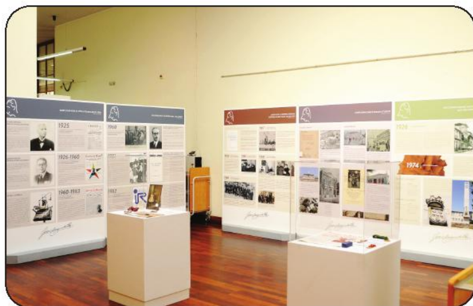
Mostra patente na Biblioteca Municipal até ao final do mês, torna-se depois itinerante

No arranque da sessão foi inaugurada a exposição biográfica "José Casimiro da