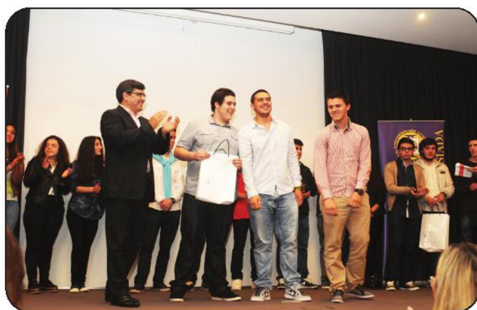
Final famalicense do concurso IN.AVE decorreu durante a Quinzena da Educação e teve lugar no auditório da Universidade Lusíada

O projeto "Safety Helmet" consiste na criação de um capacete de segurança para os trabalhadores da área da construção civil e mineira que, entre outras funcionalidades, é capaz de detetar objetos em movimento, bem como medir distâncias através de infravermelhos. A área do empreendedorismo social saiu também vencedora com o projeto "Conselheiras da Fortuna". Um serviço de aconselhamento financeiro porta a porta que pretende ajudar as pessoas a poupar.