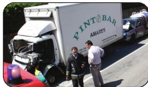
Choque em cadeia originou longas filas de trânsito em ambos os sentidos

No socorro às vítimas do acidente estiveram os Bombeiros Voluntários Famalicenses, com dez homens e três veículos (duas ambulâncias e um veículo de desencarceramento), e a VMER de