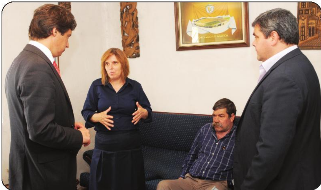
“O Povo Famalicense” acompanhou o dia da entrega do cheque a uma das famílias contemplada pelo programa, em Mouquim

Acerca da evolução do número de processos ao longos dos anos sublinha que “felizmente a necessidade não aumentou”, mas que aumentou, “e bem”, o conhecimento do projeto, o que naturalmente origina um maior fluxo de candidaturas. “Este projeto não é secreto. Aliás, nós queremos dar-lhe divulgação, respeitando a privacidade das pessoas, para que cada vez mais gente conheça o projeto e possa candidatar-se”, adianta