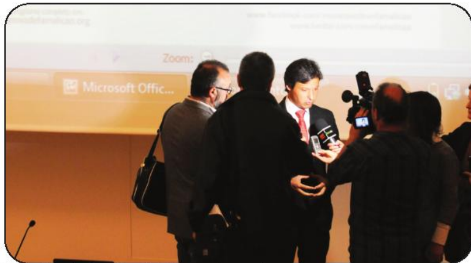
Edil considera a educação uma das principais ferramentas do progresso do concelho