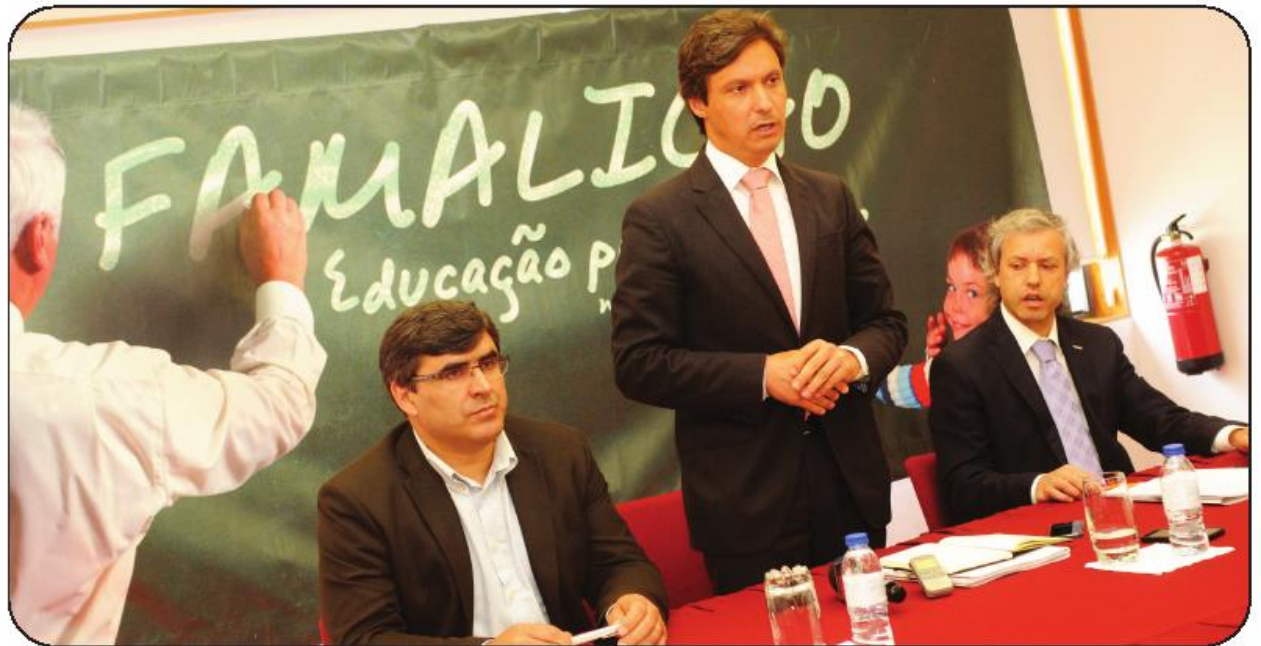
Presidente apresentou o documento acompanhado dos vereadores da Educação e Juventude

Este novo regulamento, que a partir de ontem parte para um período de discussão pública ao longo de 30 dias, “pretende acabar com o casuísmo do ponto de vista da decisão”