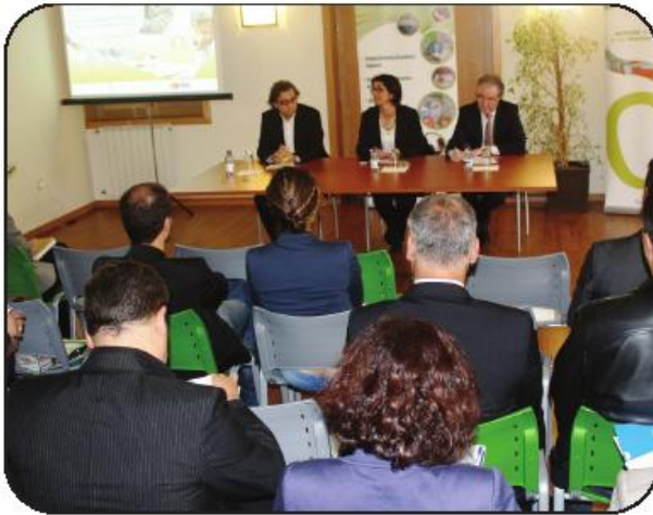
Entrega de certificados teve lugar na sede da ADRAVE

O líder da associação industrial salientou ainda a pertinência de uma formação orientada para as micro, pequenas e médias empresas, frisando que é aí que está a maioria do capital de reprodução e riqueza do país. Estas empresas, que "não têm nem têm que ter determinadas estruturas", aquelas que a formação do QI PME lhe pretende inculcar por via da qualificação de quadros, são 95,9 por cento das empresas