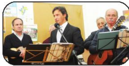
Cavaquinhos do "Liberdade" ocupam uma segunda sala...