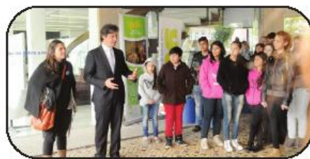
Inauguração da exposição fotográfica "Mostra-me como foi..."