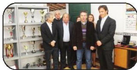
... e a Associação Desportiva Unificada Famalicense uma terceira