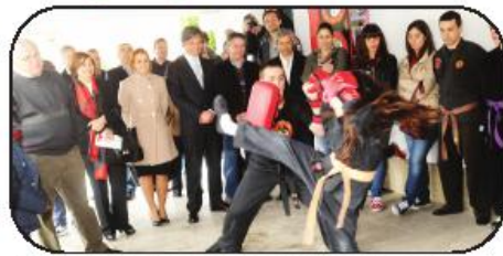
Alex Ruy Jitsu inaugurou sede na antiga escola da Magida