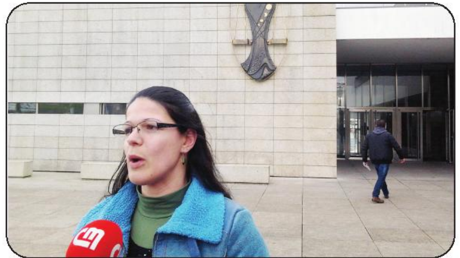
Filha da vítima insatisfeita com a pena pedida pelo MP

que a arguida seja apenas condenada por um crime de ofensa à integridade física agravada pelo resultado. Sugeriu uma pena de cinco anos, suspensa por igual período, por relevar a situação de inserção plena na sociedade, e a necessidade "de se tratar, de ter outra vida, e de esquecer o que se passou".