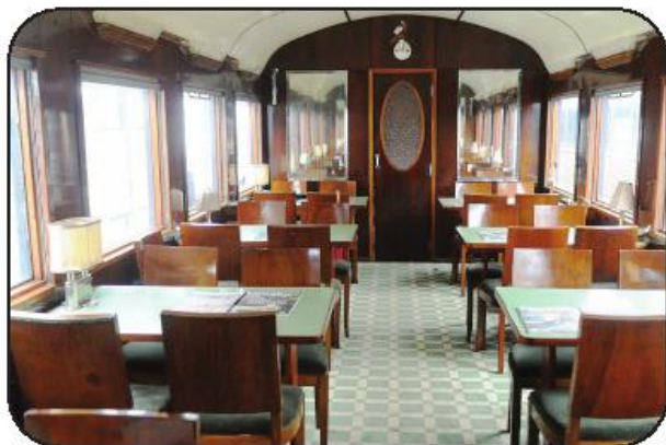
O salão restaurante