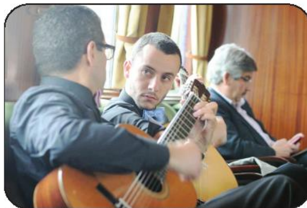
Ruído dos carris "apagado" pelo som da viola e da guitarra portuguesa