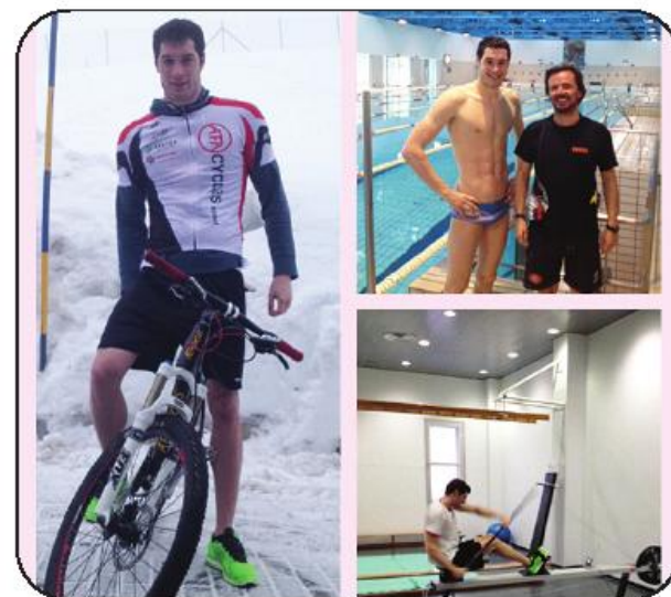
elite desportiva, erguendo bem alto o nome de Fama-

vista a melhorar a economia de nado e o consumo máximo de oxigénio". Acerca dos condicionamentos do treino, esclarece: "sabemos que estar 17 dias no centro de estágio, a treinar de forma intensa é duro, é desgastante física e psicologicamente, mas também sabemos que em alta competição é necessário ser-se forte e perseverante". No entanto, lembra que "o caminho do sucesso é a paixão por superar os limites", pelo que com este treino de preparação, "estes atletas já alcançaram este espírito e a ambição de pertencer a uma