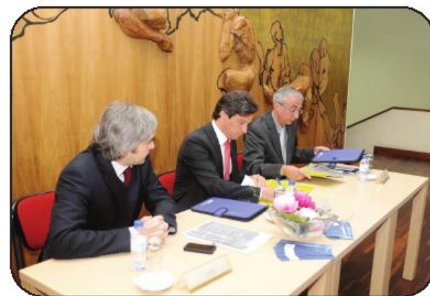
Protocolo foi assinado na Biblioteca, onde se encontra instalada a “Antena”

Feito o alerta para a necessidade de participação ativa e cidadã na dinâmica da Europa, Nuno Melo não deixou de fazer um apelo para que haja uma votação expressiva nas próximas eleições europeias, marcadas para 25 de Maio. Consciente de que este acto eleitoral tem motivado pouco os eleitores, e de que “a insatisfação generalizada quando ao fenómeno político” não contribui para a inversão desse ciclo, Nuno Melo apelou à participação. Não descarta, contudo,