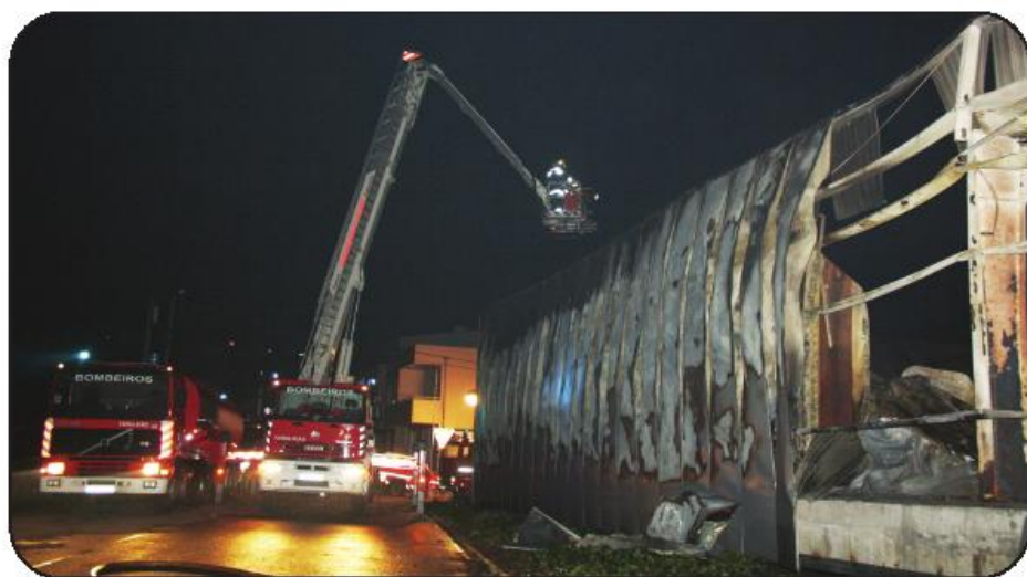
Paredes de chapa dupla dilataram com o calor e a cobertura do armazém colapsou

Na segunda-feira da passada semana, o recheio de um dos quartos de uma habitação em Avidos ficou totalmente destruído pelo fogo. O alerta foi dado cerca das 17h30, motivando a deslocação de três viaturas e oito homens para combate ao incêndio. Para além do recheio do quarto toda a habita-