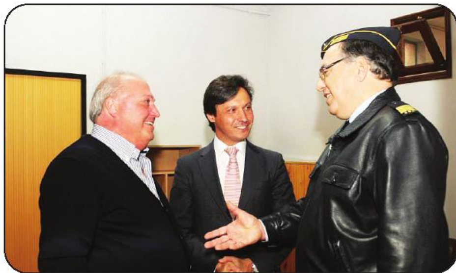
O presidente da Junta de Fradelos, acompanhado do presidente da Câmara e do Comandante da corporação

O Posto Avançado de Fradelos é já o segundo que os BVF lançam em cerca de