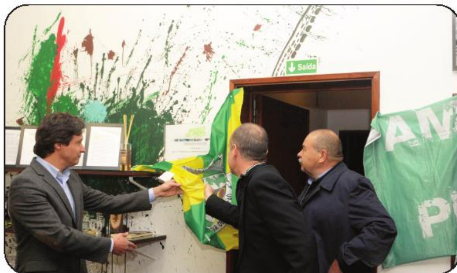
Nova sede ocupa antiga Escola de São Cláudio, em Antas

Recorde-se que depois de terem surgido como grupo informal em 2006, os "Amigos do Pedal" oficializaram-se