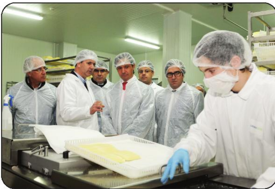
Comitiva visitou a fábrica

Para o edil, esta é uma empresa com "enorme potencial", e que se constitui como verdadeira expressão do empreendedorismo, uma vez que os dois jovens empresários responsáveis pela marca apostaram na tradição familiar, levando-a mais além e experimentando uma área na qual não tinham qualquer tipo de experiência.