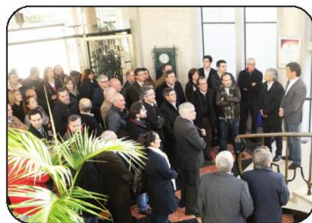
o edifício, bem como para visualizar as várias obras de arte dispersas pelo mesmo.

Recorde-se que a iniciativa "Sábados nos Paços do Concelho" decorre no primeiro sábado de cada mês. A Câmara Municipal de Vila Nova de Famalicão abre as portas ao público para uma visita guiada ao edifício e jardins dos Paços do Concelho, numa oportunidade única para os cidadãos percorrerem e conhecerem os principais espaços que compõem