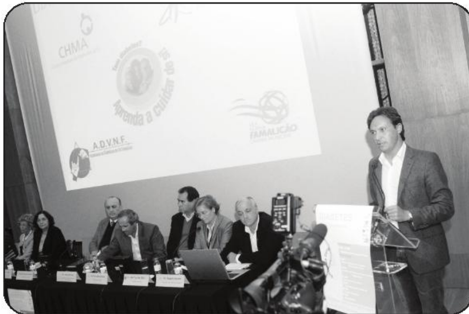
Sessão solene comemorativa teve lugar no Pequeno Auditório da Casa das Artes

Quanto à consulta de oftalmologia, outra das especialidades médicas onde se aposta num reforço de meios e técnicos, o mesmo responsável adianta que a solução