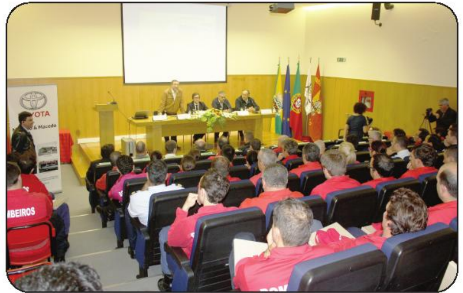
Formação teve lugar no auditório do quartel

Referindo-se ao pelouro do Voluntariado, que passa a