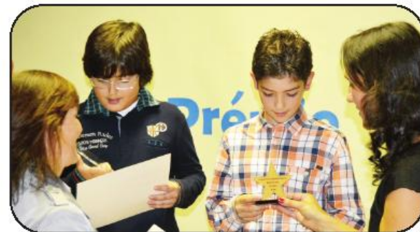
é a própria vida", conclui o Dewey. agrupamento citando J.

A intenção da cerimónia, sublinha o mesmo organismo, é que esta seja a primeira de muitas e continuadas oportunidades de congratulação do mérito e valor daqueles que acreditam que "a educação não é preparação para a vida,