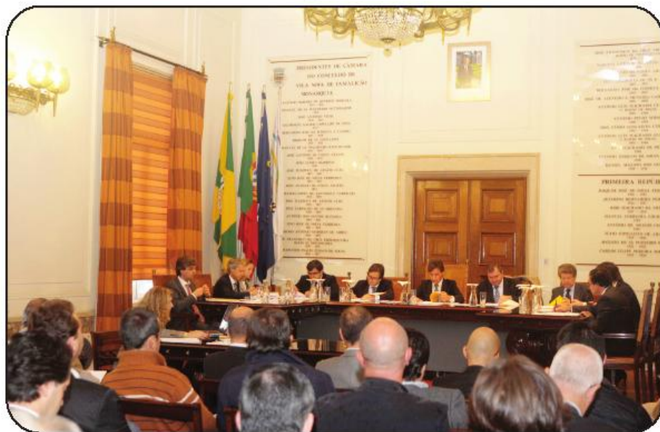
Primeira reunião pública do novo executivo contou com bastante assistência

Opondo-se à posição do PS no que toca à derrama,