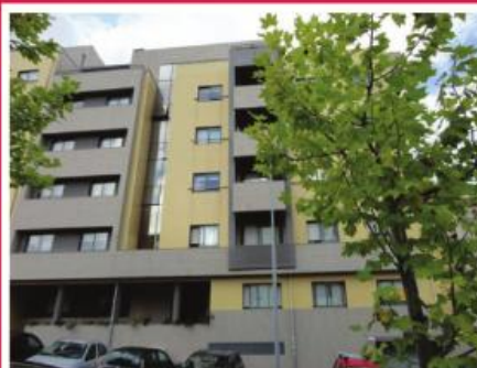
T2 com Terraço

Moradias de 2 e 3 frentes, inseridas em Urbanização moderna na freguesia do Louro, a curta distância da cidade. Construção de elevada qualidade, onde se destaca o completo equipamento: Cozinha mobilada e equipada, ar condicionado, estores elétricos, alarme e portões automatizados.