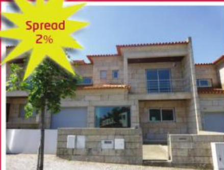
Urbanização do Outeirinho

Morada Isolada T4+2, situada em Calendário. Recentemente recuperada, inserida em terreno com 1000m 2 , todo murado, conferindo-lhe total privacidade e segurança. Ampla zona de lazer com piscina exterior rodeada de relvado e árvores ornamentais.... Venha visitar e surpreenda-se!