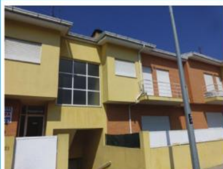
Andar de Moradia

Apartamento T3 no centro da cidade, junto aos Correios de Famalicão. Condições especiais de financiamento, até 100% com spread de 2% a 2,5%. Preço: 67.600,00€. Prestação: 212,62€/mês (prazo: 40 anos).