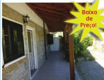
Morada em Gavião

Andar T3 inserido em Urbanização moderna, perto do centro da cidade. Com parque infantil e campo de futebol! Condições especiais de financiamento, até 100% com spread de 2% a 2,5%. Preço: 77.800,00€. Prestação: 244,70€/mês (Prazo: 40 anos).