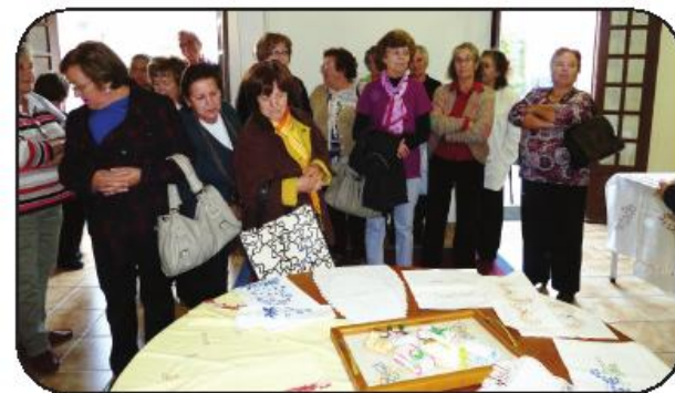
e ainda presenciarem algumas surpresas que a instituição está a organizar.

Ao longo da tarde poderão visitar as exposições de alguns ateliês a funcionar, como de pintura e decoração de materiais, artes florais, artes com trapilho, bordados