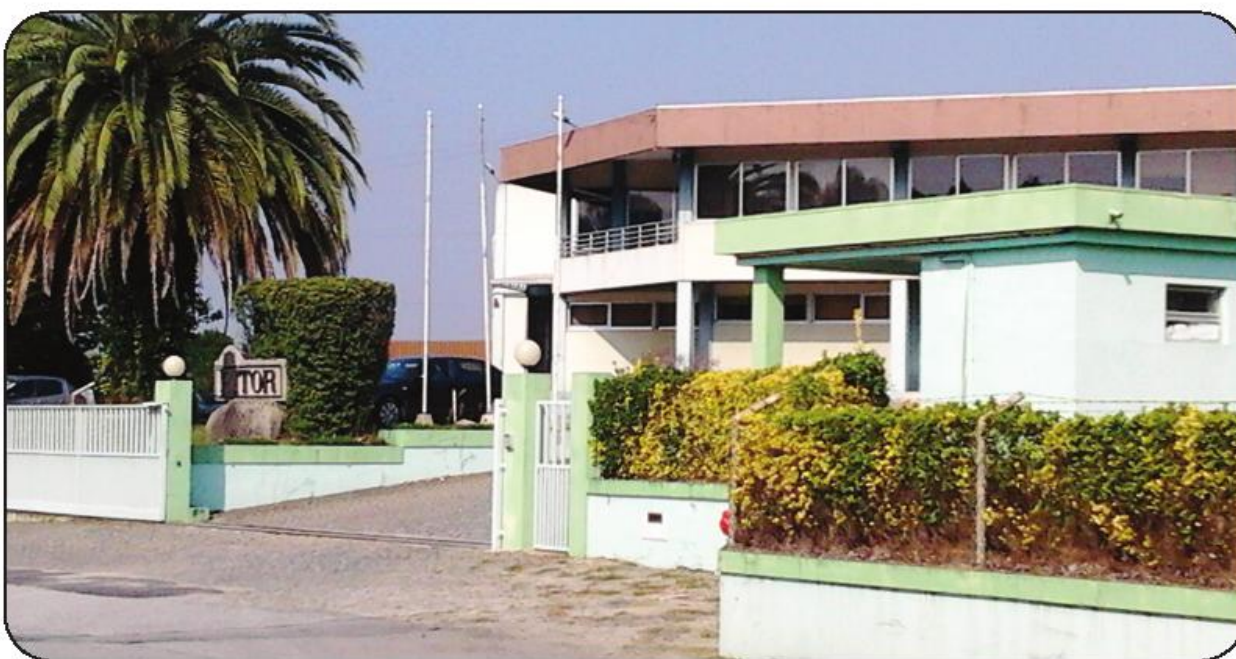
Produção da unidade de Avidos deverá passar para a Alemanha, sede da multinacional

Segundo “O Povo Famalicense” conseguiu apurar, a possibilidade de encerramento foi já apresentada aos trabalhadores, por intermédio da Comissão de Trabalhadores. A administração da empresa de Avidos terá solicitado um parecer desta sobre a reconversão proposta. A consumir-se o pior cenário, em Portugal manter-se-á apenas em funcionamento uma empresa subsidiária da “Fitor”, a “Fitor-Distribuição”, cujo papel será apenas de comercialização de fios e fibras. A produção propriamente dita passaria para a Alemanha,