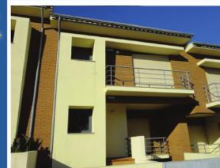
Morada em Antas

Morada T3+1 composta por rés-do-chão e 1º andar. Quintal com diversas árvores de fruto e zona de jardim. De salientar o alpendre junto à cozinha, formando um recanto muito agradável para convívio e lazer. Condições especiais de financiamento, com spread a partir de 1%!