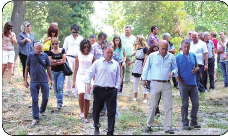
Visita às margens acompanhada por vasta comitiva, na maioria candidatos às freguesias atravessadas pelo rio