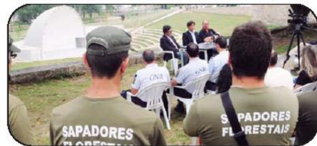
Vice-presidente apelou ao envolvimento de todos na proteção da mancha florestal