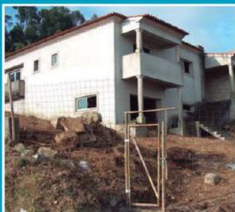
Moradia em Oliveira Sta. Maria ref: 1476

Apartamento com 126m2 de área habitável, 9m2 de varandas e garagem fechada com 32m2. A 5 km do centro de Famalicão, à face da estrada que liga à Trofa. Barbecue na varanda. Financiamento, até 100%, com spread muito atrativo. Preço: €107.000,00. Prestação: 365,38€/mês (prazo: 40 anos).