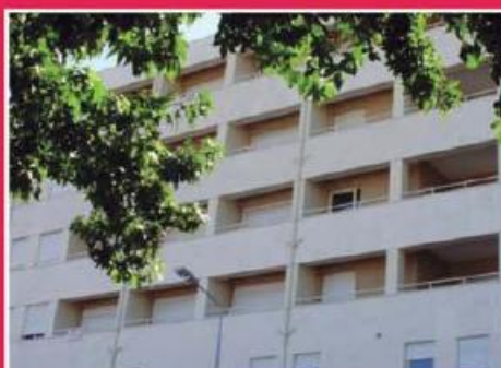
T3 Junto ao Centro ref: 1486

Apartamento T3 novo, junto ao Parque da Cidade! Equipado com aquec. central, estores elétricos, soalho maciço e vídeo porteiro. Cozinha equipada com Siemens. Condições especiais de financiamento, com spread a partir de 1%. Preço: €145.000,00. Prestação: 381,21€/mês.