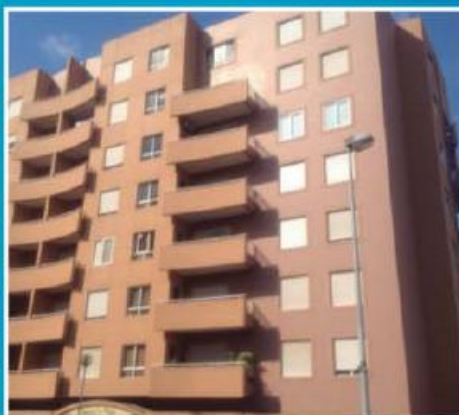
T2 no Centro ref: 1426

Apartamento localizado junto ao centro da cidade, equipado com pré-instalação de aquecimento central, caldeira, lavandaria e varanda. Garagem fechada. Financiamento, até 100%, com spread muito atrativo. Preço: €64.000,00. Prestação: 218,54€/mês (prazo: 40 anos).