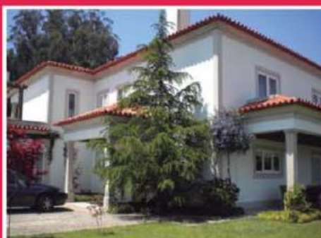
Moradia em Cruz ref: 1568

Apartamento novo situado em frente ao E.Leclerc e Mc Donald's. Garagem para duas viaturas lado a lado e arrecadação na cave com 20m2. Preço: €98.000,00.