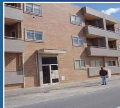
T3 em Cabeçudos ref: 1529

Apartamento de duas frentes, em ótimo estado de conservação! Duas casas de banho, varandas, roupeiro no hall de entrada. Lugar de garagem na cave. Condições especiais de financiamento. Preço: €65.000,00. Prestação: 170,89€/mês (prazo: 40 anos).