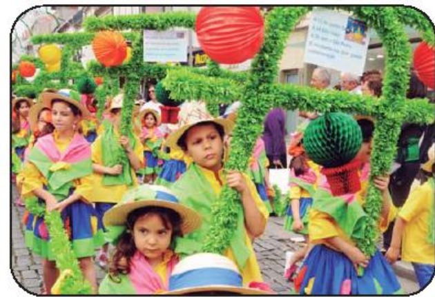
Marcha foi para o Centro Escolar Luís de Camões – Vila Nova de Famalicão.

Na edição do ano passado o Prémio de Melhor Guarda Roupas foi para a ACB - Associação de Trabalhadores do Município de Vila Nova de Famalicão e o Prémio de Melhor