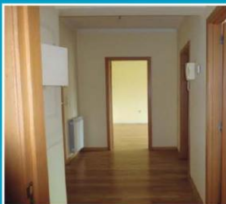
T1 em Antas ref: 1527

Apartamento localizado junto ao centro da cidade, equipado com pré-instalação de aquecimento central, caldeira, lavandaria e varanda. Garagem fechada. Financiamento, até 100%, com spread muito atrativo. Preço: €64.000,00. Prestação: 218,54€/mês (prazo: 40 anos).