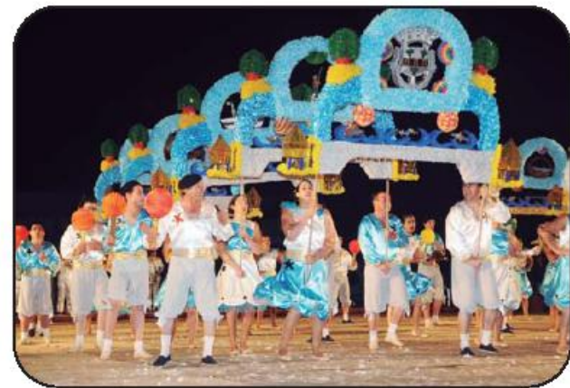
Associação Cultural de S. Salvador da Lagoa que apresentou os "Romances de Camilo", tendo conquistado o 4.º lugar.

Camilo também entrou na festa, com a atuação da As-