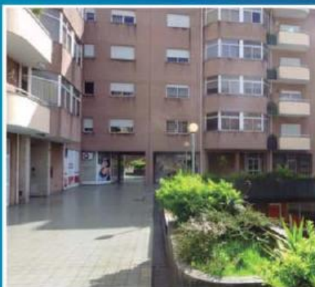
T2 em Ribeirão ref: 1544

Apartamento T2 em pleno centro de cidade, junto ao Shopping Town. Financiamento a 100% com spread de 1,5%. Preço: €75.500,00. Prestação: 217,66€/mês (prazo: 40 anos).