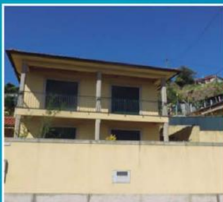
Moradia no Louro ref: 1552

Moradia Isolada com 740m2 de terreno, em fase final de construção. Condições especiais de financiamento! Preço: €118.000,00. Prestação: 310,23€/mês (prazo: 40 anos).