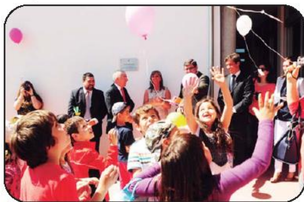
Largada de balões no momento da inauguração

Na escola de Vale S. Cosme, "o primeiro lugar onde o sol bate e diz 'bom dia'", descreveu o edil famalicense, foram investidos um total de 300 mil euros. A verba permitiu a reabilitação total do edifício com pintura, substituição de instalação elétrica, reparação do teto falso existente, entre outras, e serviu ainda para a ampliação do