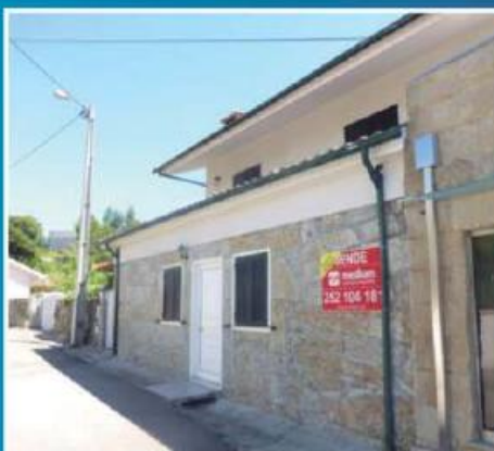
Moradia em Gavião ref: 1571

Moradia Isolada T3, com 220m2 de área útil e 600m2 de terreno. Bonito jardim e pomar nas traseiras. Excelente exposição solar (Nascente/Sul). Condições especiais de financiamento, com spread de 1%! Preço: €195.000,00. Prestação: 512,66€/mês (prazo: 40 anos).