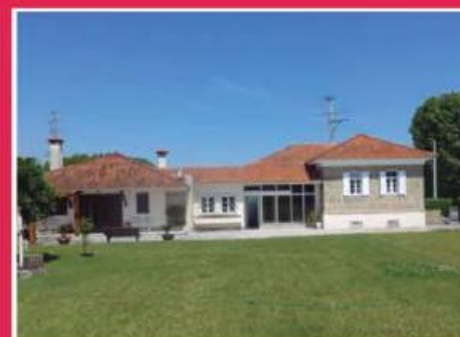
Quintinha em Antas ref: 1567

Moradia T4 inserida no "Condomínio da Boavista" em Cruz. Construção recente, com elevada qualidade e conforto. Com vista para cidade a uma curta distância, ou para o horizonte distante e vazio, num clima de paz e descontração, longe do bulício e da confusão. Venha conhecer!