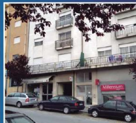
Loja em Riba de Ave ref: 1376

Moradia T3+1, composta por rés-do-chão e 1º andar e anexo para garagem. Quintal com diversas árvores de fruto, e zona de jardim. De salientar o alpendre junto à cozinha, formando um recanto muito agradável para convívio e lazer. Condições especiais de financiamento! Preço: €215.000,00. Prestação: 565,24€/mês (prazo: 40 anos).