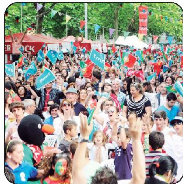
No ano passado, os "Toninhos" foi recinto privilegiado de apoio à Seleção Nacional

PM - A opinião geral de todas as pessoas que o ano passado passaram pelo recinto era de contentamento geral. É uma nova versão das Festas Antoninas, a que os mais jovens não ligavam muito. Esta vertente nocturna agrada a todos, mesmo aos bares presentes, porque até então, na semana das festividades, perdiam um bocadinho em termos de negócio, pela falta de