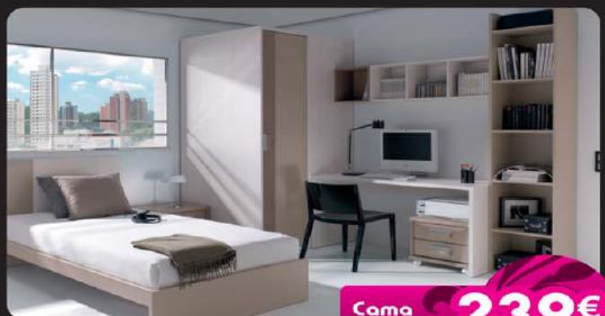
Cama Juvenil 239€