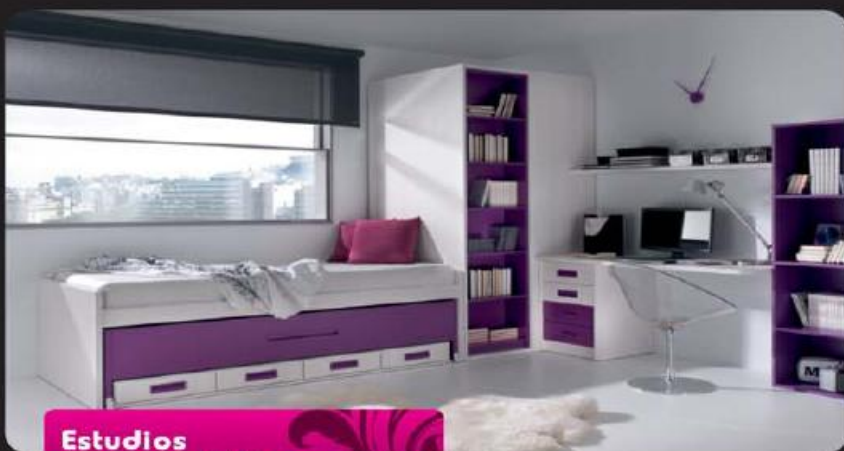
Estudios à sua medida