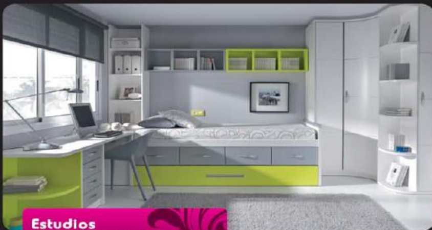
Estudios à sua medida