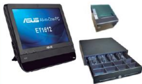
POS Low Cost All in One