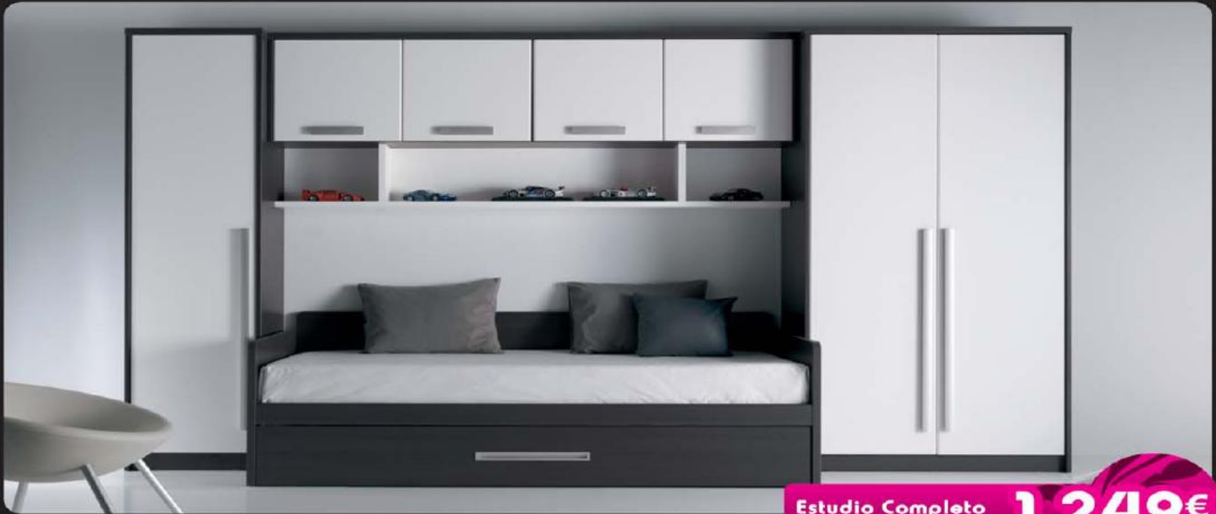
Estudio Completo (Várias Cores) 1.249€

PRECISA DE MAIS ESPAÇO? SOLUÇÕES À SUA MEDIDA E AO MELHOR PREÇO!