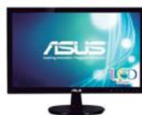
Monitor ASUS VS197DE 18.5"