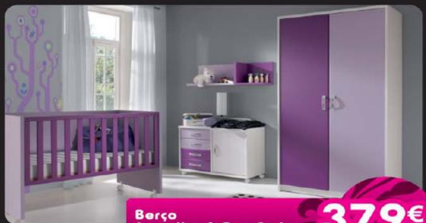
Berço (escolha A Sua Cor) 379€