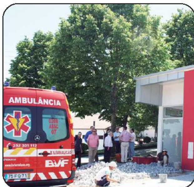
Posto está no meio de uma vasta zona habitacional e tem acessibilidades privilegiadas

O Posto Avançado conta, para já, com uma ambulância e um piquete de duas pessoas que assegurará emergência de proximidade entre as 09h00 e as 18h00 de todos os dias da semana. No entanto, a corporação está já a formar pessoal no sentido de assegurar muito em breve o funcionamento 24 horas por dia, incluindo fins-de-semana e feriados. A funcionar desde ontem, segunda-feira, os pedidos de socorro podem ser acionados via INEM e CODU (Centro de Orientação de Doentes Urgentes), ou através de recurso direto das populações para o número 252 921 140.