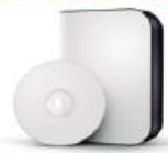
Software de Facturação