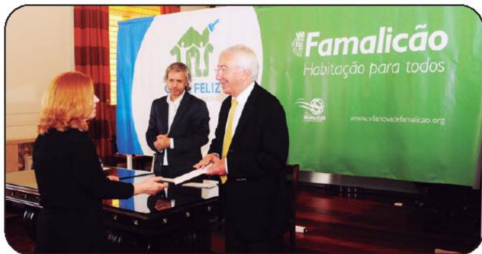
Presidente da Câmara entregou cheques a novos beneficiários do programa

Refira-se que através do programa municipal “Casa Feliz”, as famílias de escasos recursos económicos podem ter acesso a um apoio financeiro da Câmara Municipal até 5 mil euros para a realização de obras de reparação da habitação própria. Lançado em 2005 o programa já concretizou mais de uma centena de processos de reabilitação de casas degradadas, tendo o município participado com um total de mais de 500 mil euros.