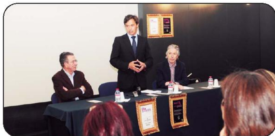
Comemorações apresentadas no Museu da Guerra Colonial