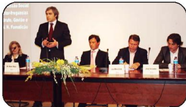
Nuno Melo debateu o futuro da Europa em Famalicão

Defensor de uma Europa federal, Nuno Melo considera que é tempo e emendar o rumo que foi percorrido nas últimas décadas, e que muitos prejuízos trouxe a Por-