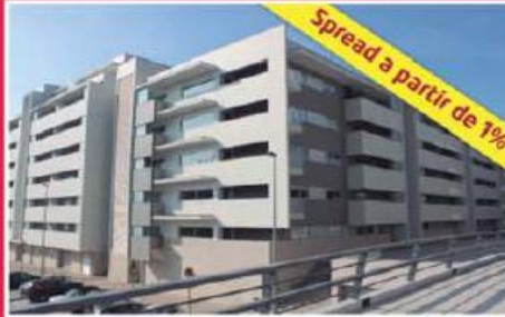
Vila Parque ref: 1150 (3)

Apartamento novo situado em frente ao E. Leclerc e Mc Donald's. Garagem para duas viaturas lado a lado e arrecadação na cave com 20 m 2 . Preço: €98.000,00.