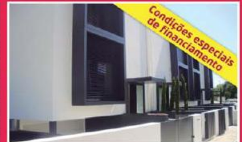
Moradias Centro da Cidade ref: 1340(1)

Inserida em urbanização tranquila com habitações unifamiliares de boa qualidade, servida de boas infraestruturas, tais como água, eletricidade, gás e telefone. Moradia de 3 frentes, em estado de nova, de arquitetura moderna e boa qualidade de construção. Preço: €175.000,00.