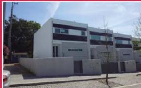
Moradia em Requião ref: 1546

Moradia Geminada, equipada com painéis solares, portões automatizados, lavandaria, recuperador de calor, focos embutidos, blackout's e estores elétricos. Bons acabamentos, tais como carpintaria esmaltada a branco. Garagem fechada para duas viaturas. Preço: €160.000,00.