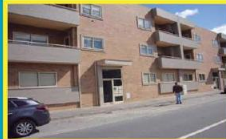
T3 em Cabeçudos ref: 1529

Apartamento T2 em pleno centro de cidade, junto ao Shopping Town. Financiamento a 100% com spread de 1,5%. Preço: €75.500,00. Prestação: 217,66€/mês (prazo: 40 anos).