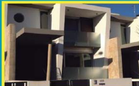
Moradia em Viatodos ref: 1475

Lotes de terreno com moradias em fase inicial de construção. Com licença de construção. Possibilidade de financiamento! Preço: €50.000,00.