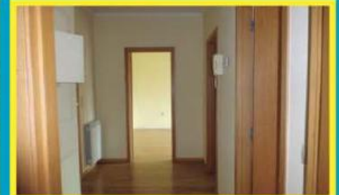
T1 em Antas ref: 1527

Apartamento com 126m 2 de área habitável, 9m 2 de varandas e garagem com 32m 2 . A 5 km do centro de Famalicão. Barbecue na varanda. Financiamento, até 100%, spread muito atrativo. Preço: €107.000,00. Prestação: 365,38€/mês (prazo: 40 anos).