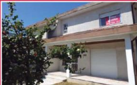
Moradia em Gavião ref: 1534

Apartamento T4 Duplex no último andar, situado no centro da cidade, junto à Rotunda da Paz. Com enorme terraço privativo e garagem individual para 4 viaturas. O apartamento foi totalmente remodelado, seguindo os critérios atuais de qualidade e conforto. Consulte-nos!