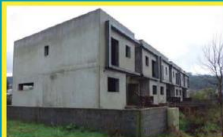
Lotes em Vale S. Cosme ref: 1506

Moradia Isolada T3, com 220m 2 de área útil e 600m 2 de terreno. Bonito jardim e pomar nas traseiras. Excelente exposição solar (Nascente/Sul). Condições especiais de financiamento, com spread de 1%! Preço: €195.000,00. Prestação: 512,66€/mês (prazo: 40 anos).