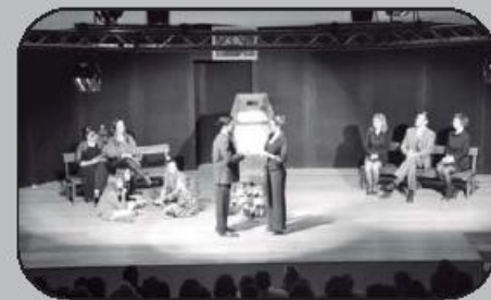
grupo organizador GRUTACA.

Perante uma sala totalmente lotada, o Teatro ACV tomou conta da noite em torno da comédia de autoria portuguesa. No final, ainda por Terras de Camilo, a noite acabou animada numa confraternização com o