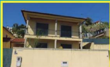
Moradia no Louro ref: 1552

Apartamento junto ao centro da cidade, equipado com pré-instalação de aquec. central, caldeira, lavandaria e varanda. Garagem fechada. Financiamento, até 100%, com spread muito atrativo. Preço: €64.000,00. Prestação: 218,54€/mês (prazo: 40 anos).