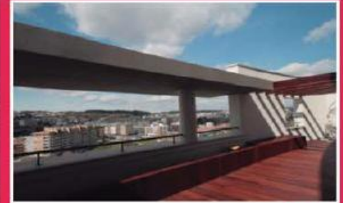
T4 Duplex no Centro ref: 1541

Apartamento com 455m 2 de área bruta, situado no centro da cidade. Com 2 terraços a todo o comprimento da habitação. Quatro suites, duas caldeiras, aspiração central, vidros duplos e vídeo porteiro. Dois lugares de garagem. Preço: €170.000,00.