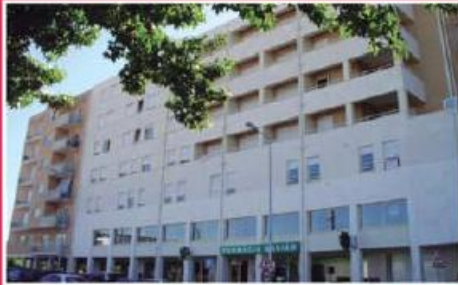
T3 Junto ao Centro ref: 1486

Apartamento novo situado em frente ao E. Leclerc e Mc Donald's. Garagem para duas viaturas lado a lado e arrecadação na cave com 20 m 2 . Preço: €98.000,00.