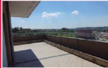
T5 Duplex ref: 1550

Apartamentos novos junto ao Parque da Cidade, com excelentes condições de financiamento, até 100%, com spread a partir de 1%! Preços desde €128.250,00 (Prestação: 335,93€/mês). Não perca esta oportunidade!