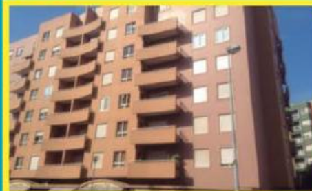
T2 no Centro ref: 1426

Apartamento de duas frentes, em ótimo estado de conservação! Duas casas de banho, varandas, roupeiro no hall de entrada. Lugar de garagem na cave. Condições especiais de financiamento. Preço: €65.000,00. Prestação: 170,89€/mês (prazo: 40 anos).