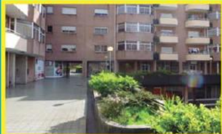
T2 em Ribeirão ref: 1544

Apartamento de duas frentes, em ótimo estado de conservação! Duas casas de banho, varandas, roupeiro no hall de entrada. Lugar de garagem na cave. Condições especiais de financiamento. Preço: €65.000,00. Prestação: 170,89€/mês (prazo: 40 anos).