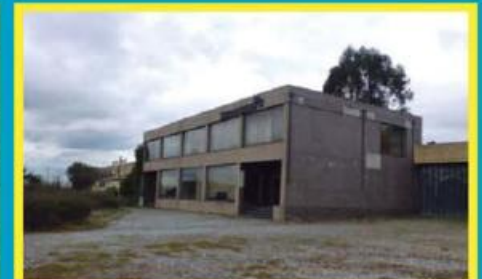
Armazém em Gavião ref: 1520

Moradia Geminada de excelente qualidade, amplas áreas. Garagem para 3/4 viaturas. Financiamento até 100% com spread de 1%! Preço: €149.670,00. Prestação: 402,24€/mês (prazo: 40 anos). Se a escritura for celebrada até 30 de Maio, beneficia ainda de 2%.