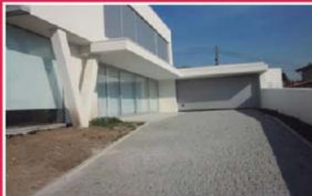
Moradia T3+1 em Joane ref: 1336

Moradia Geminada de tipologia T4, localizada muito próxima do centro da cidade. Com 471,50m 2 de área bruta. Preço: €155.000,00.