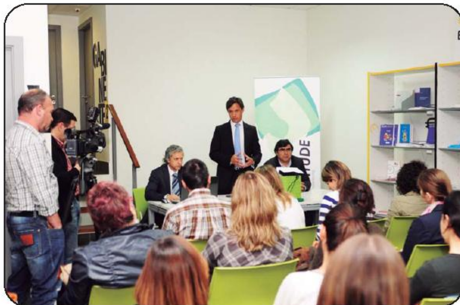
Casa da Juventude acolheu apresentação da nova plataforma

Segundo o titular da pasta da Juventude, que deu a conhecer a forma de utilizar o novo portal, este é um “instrumento facilitador” na procura da oferta educativa e formativa no perímetro do concelho, agilizando o acesso e