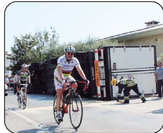
Trânsito fez-se alternado, inicialmente, e depois teve que ser cortado