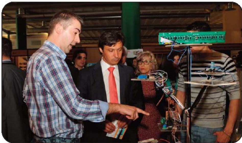
Vice-presidente visitou stands e contactou com alunos e docentes

Mais de cem as escolas secundárias e profissionais, universidades e associações com formação formativa, exército, polícia municipal, entre outras instituições da região, estiveram presentes na Mostra Pedagógica e de Oferta Formativa que decorreu até à passada quinta-feira no Lago Discount. A iniciativa promovida pela Câmara Municipal de Famalicão insere-se no âmbito da Quinzena da Educação.