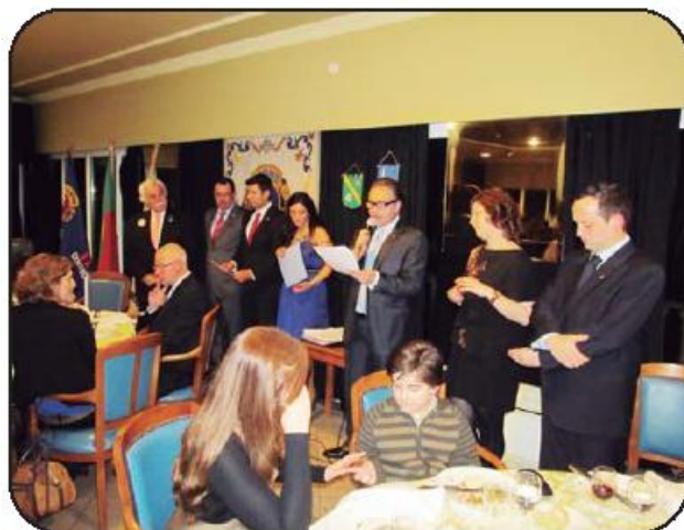
Lions projeta o futuro

O aniversário serviu ainda para apresentação de mais um projeto, o SIMBA – Projeto de Proteção Social do Interesse Maior da Criança e do Jovem, iniciativa para a qual reverterá na totalidade a tómbola solidária realizada no decorrer do Jantar.