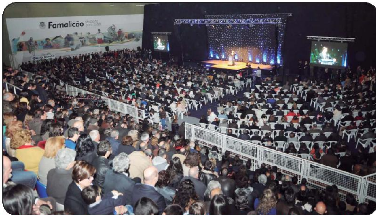
Lotação do Pavilhão Municipal esgotou por completo e houve mesmo quem não tivesse conseguido entrar para a apresentação oficial do candidato da coligação PSD/PP