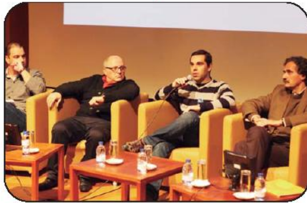
Especialistas falaram da necessidade de um maior reconhecimento

Pela Casa das Artes passaram mais de 42 jovens de Portugal, Roménia, Alemanha, Hungria, Argentina, Brasil, Peru e Cabo Verde num projeto cofinanciado pelo Programa Juventude em Ação. Os parceiros demonstram a diversidade de áreas de trabalho desenvolvidos pelo movimento da sociedade civil: ASONEDH (Associação de defesa e promoção dos direitos humanos do Peru), ECFA (Espaço Cultural Francisco de Assis França, no Brasil), Centro de Juventude de Mindelo (Cabo Verde, na cidade geminada de Vila Nova de Famalicão), Agendo 21 (Argentina), Juggendtreff (Alemanha), Centro de Voluntariado Juvenil (Roménia), TE