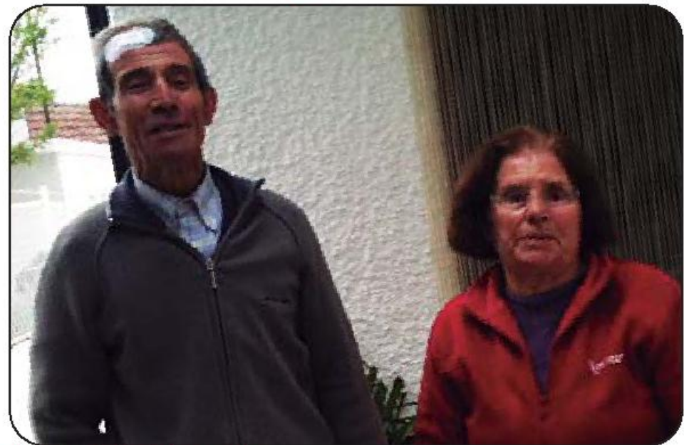
O casal foi uma das vítimas dos jovens suspeitos

Os outros dois arguidos do processo são acusados de terem encaminhado o ouro roubado. O mais jovem é acusado de receptação, tendo colaborado na venda do material apesar de ter conhecimento da sua proveniência ilegítima. Em tribunal admitiu ter encaminhado os jovens a uma loja