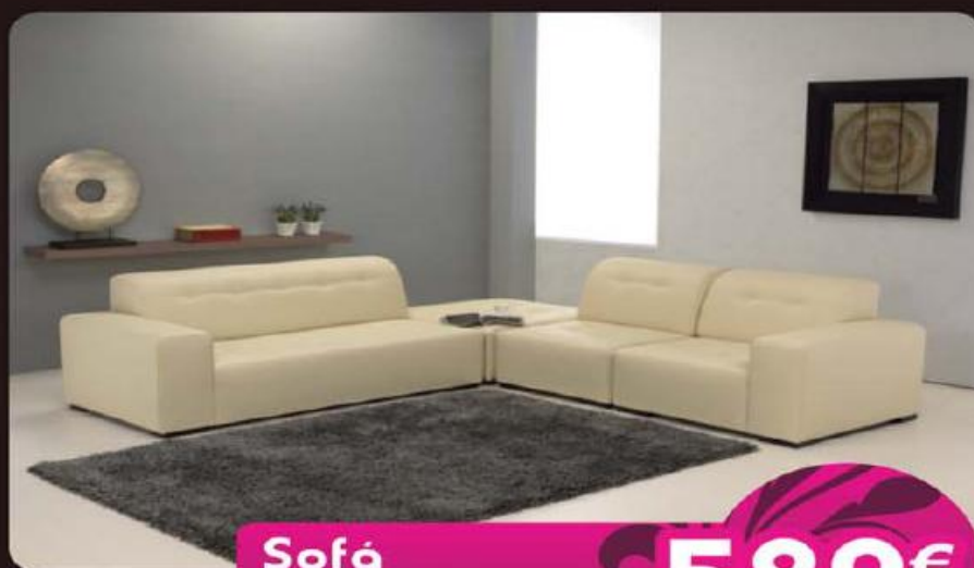
Sofá com várias configurações