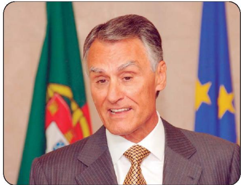
Chefe de Estado associa-se à inauguração da nova fábrica da Leica

Este é um projecto considerado vital para a Continental Mabor, enquanto parte integrante do plano de expan-