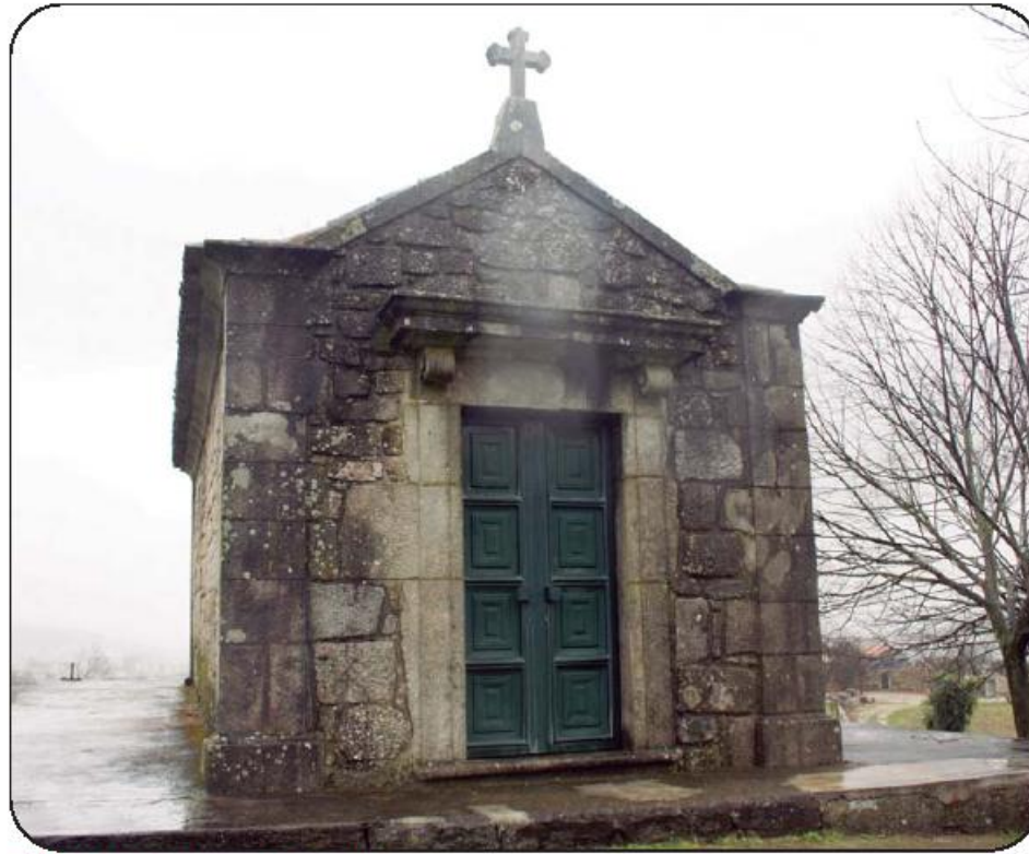
Capela terá sido Igreja Paroquial no Século XIV

A Capela, que se supõe ter sido Igreja Paroquial no século XIV, terá sido lugar de veneração até ao ano de 1988, segundo defende a família que reclama a posse. Terá sido neste ano que, dada a relevância histórica do monumento, e o seu mau estado de conservação, a Junta terá feito uma abordagem à família no sentido de uma intervenção de vulto que lhe restituísse dignidade. O que consta das alegações da família dá conta da concordância desta com a iniciativa da Junta, sob promessa de entrega de uma chave. No entanto, a família alega nunca ter recebido da Junta uma cópia da chave da Capela, apesar de ao longo dos anos