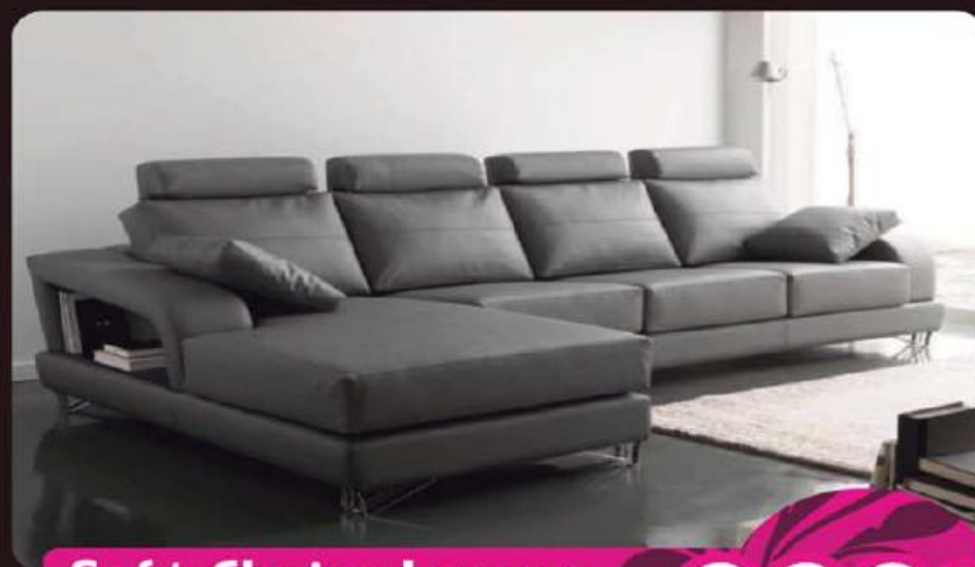
Sofá Chaise Longue Onix (Varios Tecidos e Medidas)