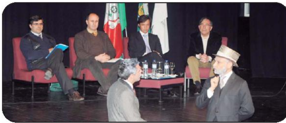
Evento teve lugar no Centro Cultural de Joane, que teve casa cheia

Em debate, neste primeiro Fórum Comunitário estiveram diversos temas com destaque por exemplo para a questão da cobertura das respostas sociais face às alterações demográficas, visíveis na pirâmide etária, em que as crianças e jovens estão a diminuir e as pessoas com mais de 65 anos a aumentar. Mas o fórum abordou também a questão do desemprego e aquilo que pode ser desenvolvido localmente para combater este fenómeno crescente. Outra questão foi ainda o papel da escola e da educação no estímulo do espírito crítico e da participação.