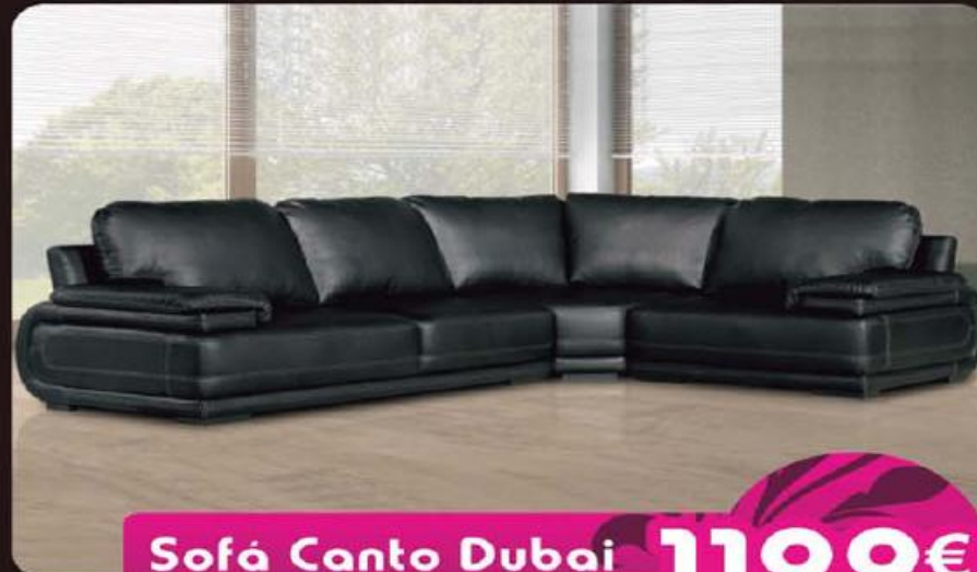
Sofá Canto Dubai (Vários Tecidos e Cores)