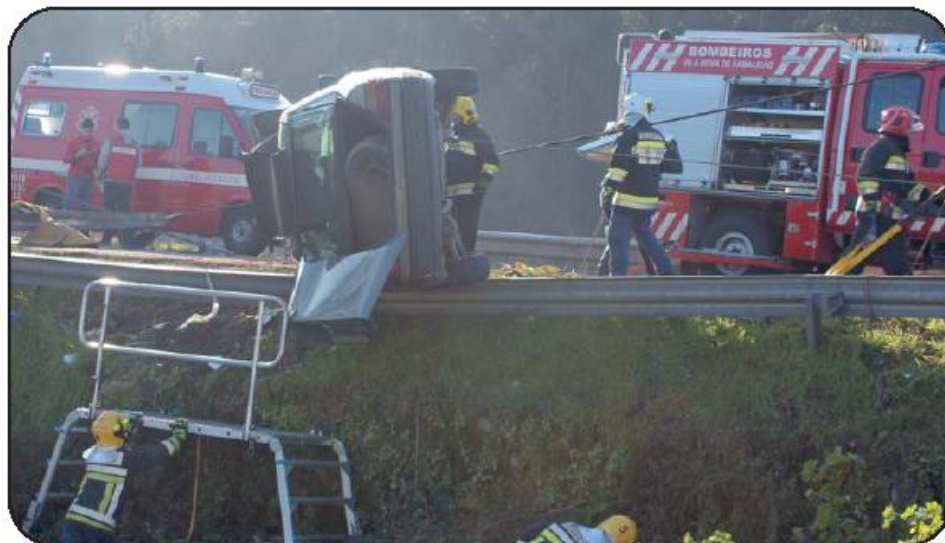
Carro ficou na extremidade de uma ravina, e bombeiros tiveram que montar plataforma para desencarcerar o condutor