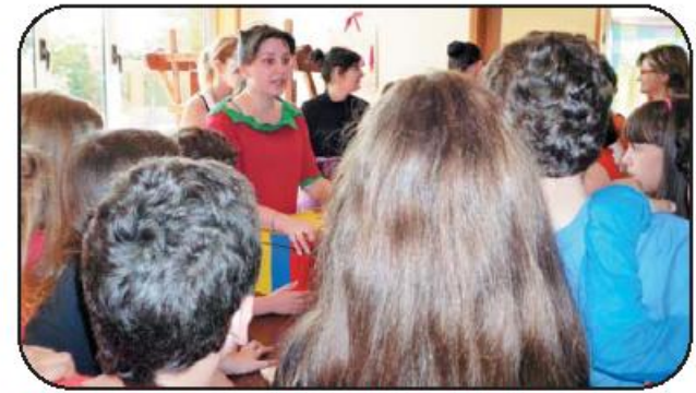
Melhorar a qualidade dos serviços prestados é o objectivo principal do Plano Estratégico

Para cada um destes "eixos" são apontadas medidas, acções, projectos e iniciativas tendentes a atingir os