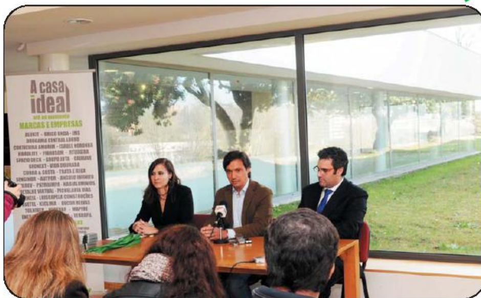
Certame é o primeiro de outros com diferentes abordagens e temas

A feira terá entrada gratuita, contando com iniciativas paralelas para além da exposição de materiais e serviços.