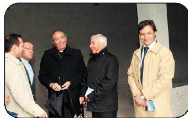
Presidente, acompanhado de outros autarcas e do Arcebispo Primaz de Braga

A cerimónia contou ainda com as presenças do Arce-